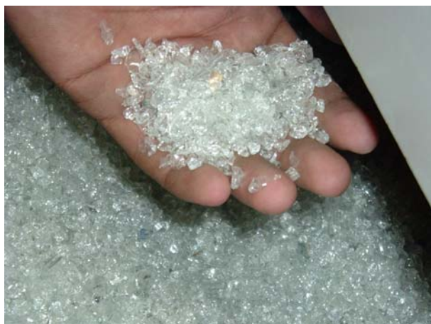
Figura 2. Amostra de Vidro Pirex