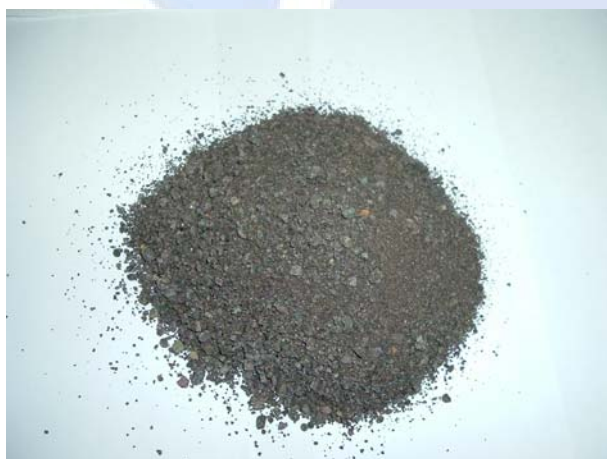
Figura 3. Amostra de basalto