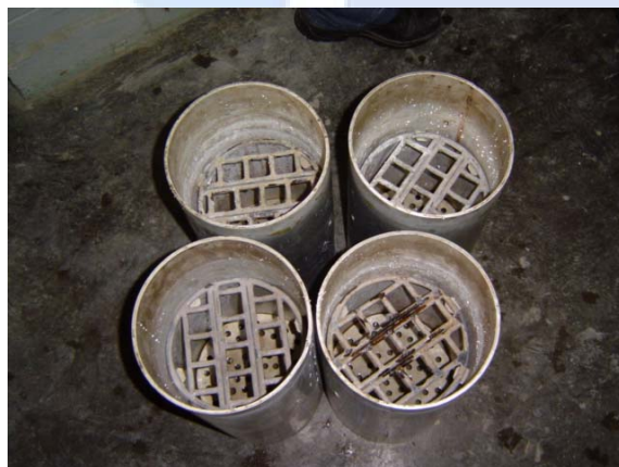
Figura 6. Recipientes para o ensaio

Assim como no primeiro ensaio, foram moldados 3 corpos-de-prova prismáticos com as mesmas dimensões. Logo após a desmoldagem dos corpos-de-prova, é realizada a leitura inicial com o mesmo comparador de comprimentos utilizado no ensaio anterior, em seguida, os corpos-de-prova são colocados em recipientes próprios para o ensaio (Figura 6) com uma determinada quantidade de água por 14 dias. Após este período é realizada a leitura final com o comparador de comprimentos.