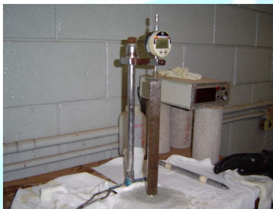
Figura 4. Realização da leitura inicial

O método de reatividade acelerado utilizado tem como objetivo investigar a reação através do acompanhamento da variação de comprimento de barras de argamassa. A medição desta variação é feita com um comparador de comprimentos com precisão de 0,001mm (Figura 4). Foram confeccionadas três barras de argamassa nas dimensões de 25 mm x 25 mm x 285 mm com relação cimento: agregado 1: 2,25 (em massa) e uma relação água/cimento igual a 0,47. As porcentagens de substituição ao cimento por CCA adotadas foram de 5 e 10%. Estes teores foram usados para que fosse possível verificar se a CCA influencia na diminuição da reação álcali-agregado com pequenas porcentagens de substituição ao cimento.