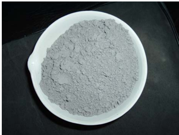
Figura 1. Amostra de CCA após a moagem