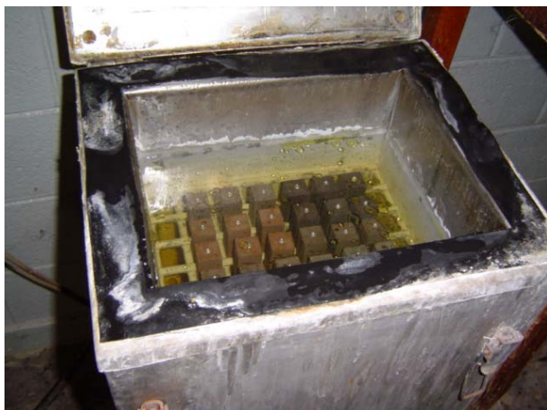
Figura 5. Câmara com NaOH