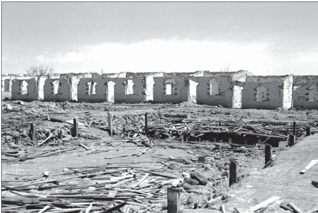
Figura 4. Estado actual de la Oficina Salitrera Vergara.

dos privativos de esta Oficina. Así, resaltan duendes traviesos y juguetones que alteran la vida de las familias; un hombre de más de dos metros, que a pesar de haber sido enterrado en el cementerio hace muchos años, sigue creciendo varios centímetros al año; otro, que le ha pedido a un taxista que lo lleve al campo santo, y una vez que el conductor se vuelve a cobrar el importe, el pasajero misteriosamente desaparece, para ser visto con su terno café cerrando la puerta desde el interior del cementerio. No es extraño, también, escuchar de misteriosas huellas de 50 o 60 cm, las que son atribuidas a seres extraterrestres, y al mismísimo diablo, el que a veces llega confundido en un remolino, o se aparece al interior de los hogares.