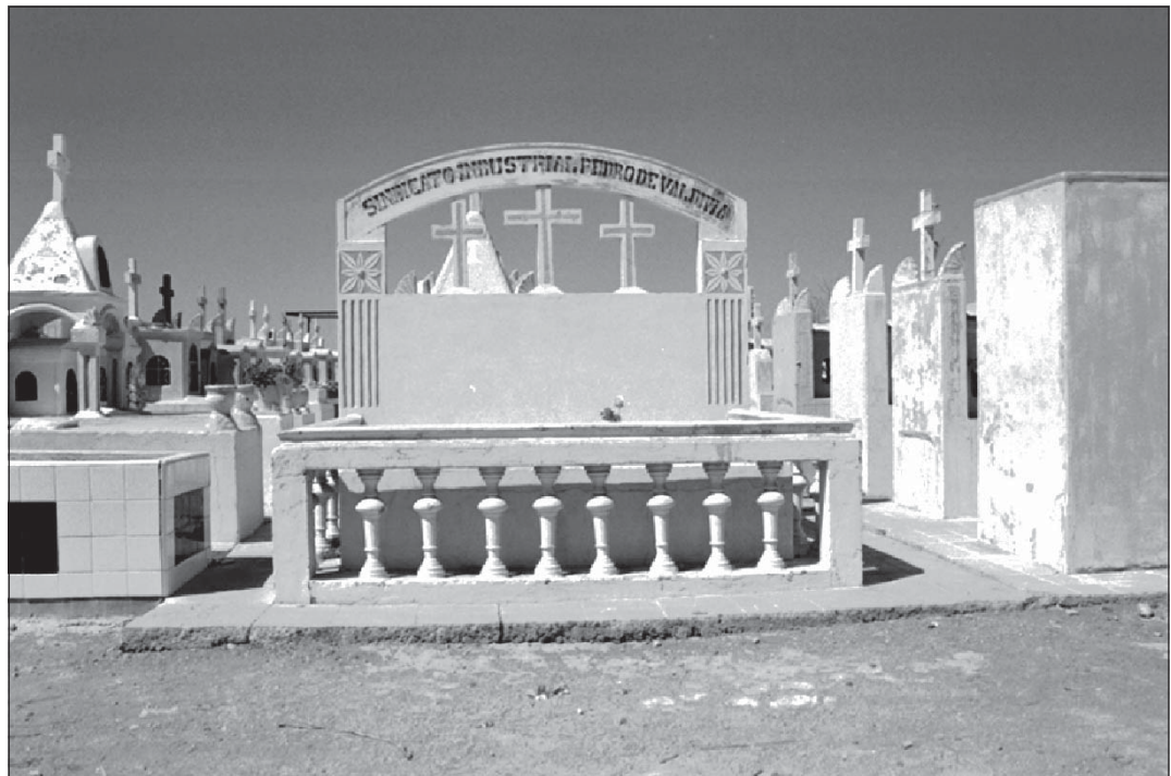
Figura 5. Cementerio de Vergara: Tumbas de los dirigentes sindicales caídos tras la huelga de 1956.

Mira con desdén sobre las tumbas, y suelta sus emociones: