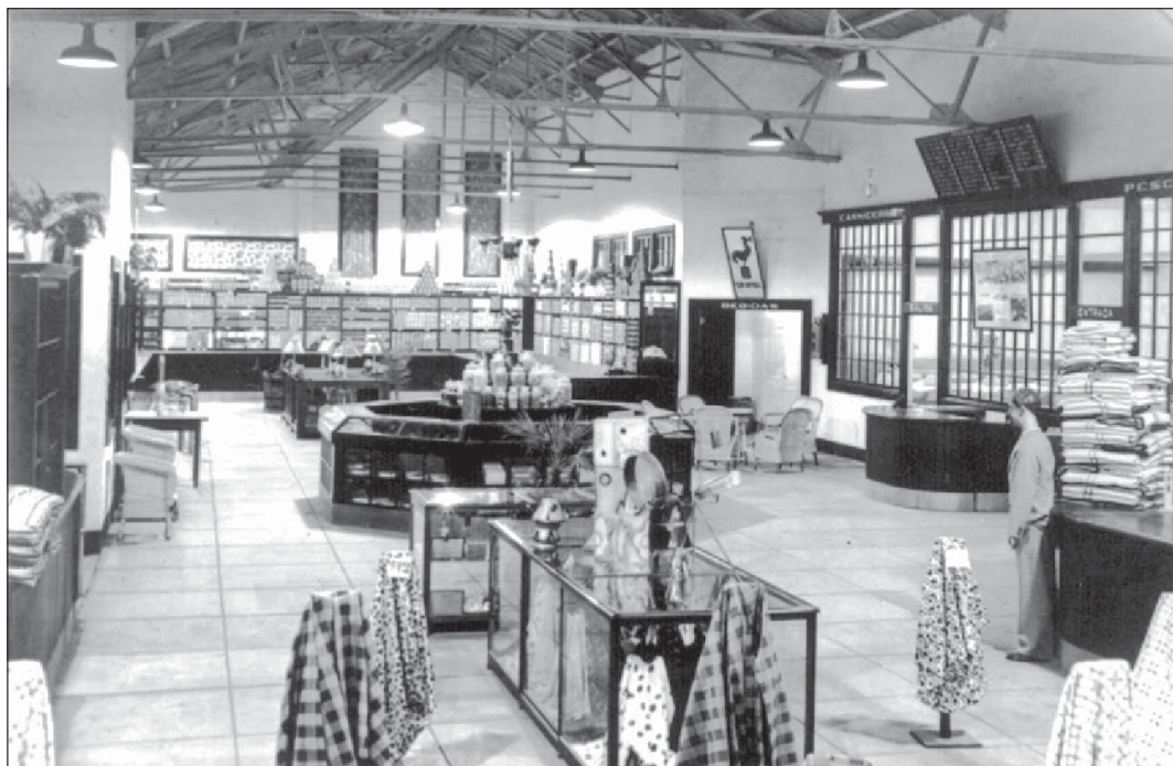
Figura 3. Vista interior de la sala de telas de la antigua pulpería de María Elena.

“Los de María Elena son casi todos de la cuarta región. En cambio, los de Pedro de Valdivia son de Santiago al sur”.