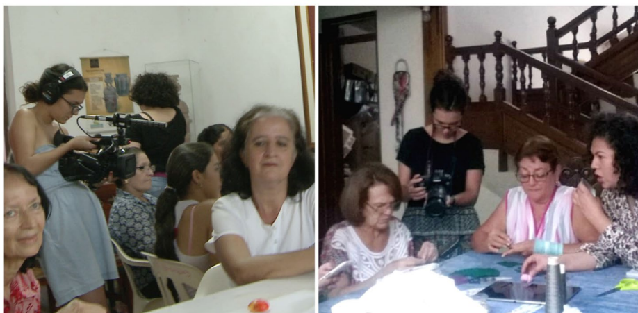
Figura 7. Investigadora registrando el desarrollo de distintas actividades