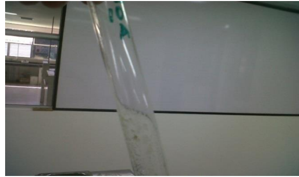
Fig. 1. Ensayo en salchicha de pescado conservada con nitritos.

Con este tratamiento, las esporas de Clostridium sulfito reductor no crecieron en ninguna de las diluciones realizadas, al igual que en otros estudios la calidad microbiológica de embutidos tipo pepperoni durante la fermentación de este (ver Fig. 1), se comprobó la ausencia de los microorganismos patógenos empleando nitritos y cloruro de sodio [11]. Así mismo en investigaciones previas sobre la influencia de especias en salchichas bratwurst el crecimiento de esporas de C. reductor (<10) no fue tan significativo a pesar que no se utilizó en la formulación nitritos, sin embargo, cuando no se utilizan este tipo de sales el crecimiento de este microorganismo puede crecer en mayor grado, aunque la utilización de especias naturales contribuyen a reducir la carga microbiana en este tipo de productos [12].