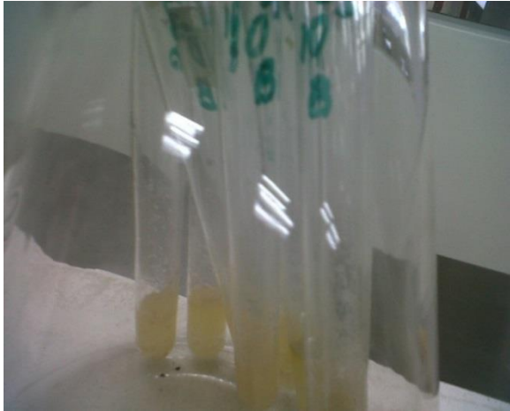
Fig. 2. Ensayo en salchicha de pescado conservada con lactato de sodio.

disminuyó la L. monocytogenes en números de 0,4 a 0,8 log UFC/g por más de 120 días en comparación con el tratamiento control.