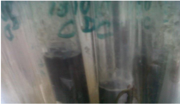
Fig. 4. Ensayo en salchicha de pescado sin conservantes.