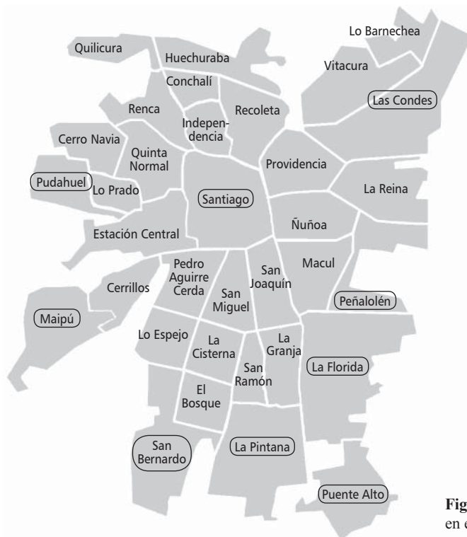
Figura 1. Mapa de Santiago, Chile. Comunas incluidas en el estudio (en círculos).

La tasa de mortalidad infantil (i.e. muertes en menores de 1 año/1 000 nacidos vivos inscritos) de Chile y de las comunas incluidas fueron obtenidas a partir de los Anuarios de Demografía, publicados por el Instituto Nacional de Estadísticas 7 . Por su parte, el índice de pobreza (i.e. porcentaje de personas que viven en condiciones de pobreza, indigentes y pobres no-indigentes) se obtuvo a partir de los datos reportados por la Encuesta de Caracterización Socioeconómica (CASEN), realizada por el Ministerio de Planificación y Cooperación 8 . Se registraron datos incluidos en el período 1990-2006, cada 4 años (1990, 1994, 1998, 2003 y 2006). Se incluyó el año 2003 en lugar del 2002 debido a que la encuesta CASEN se realizó en el primero, no así en el segundo.