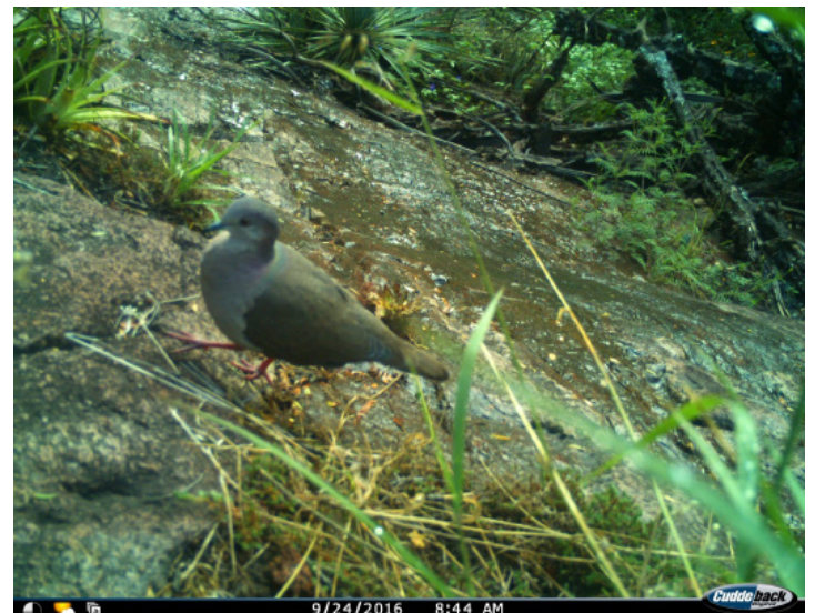
Figura 1. Individuo de Leptotila plumbeiceps registrado en el río Manzanares, Reserva de la Biosfera Sierra Gorda de Guanajuato.

Nuestro registro es el primero documentado para el estado de Guanajuato. L. plumbeiceps es una especie ampliamente distribuida en las tierras bajas del Golfo de México y la vertiente este de la Sierra Madre Oriental que no había sido incluido en listados avifaunísticos efectuados en la RBSGG (Ramírez-Albores et al. 2015) ni para Guanajuato (Gurrola-Hidalgo et al. 2012). Este registro se localiza en los límites de las provincias bióticas Sierra Madre Oriental y Altiplano Mexicano; es la primera vez que la paloma cabeza ploma es registrada en