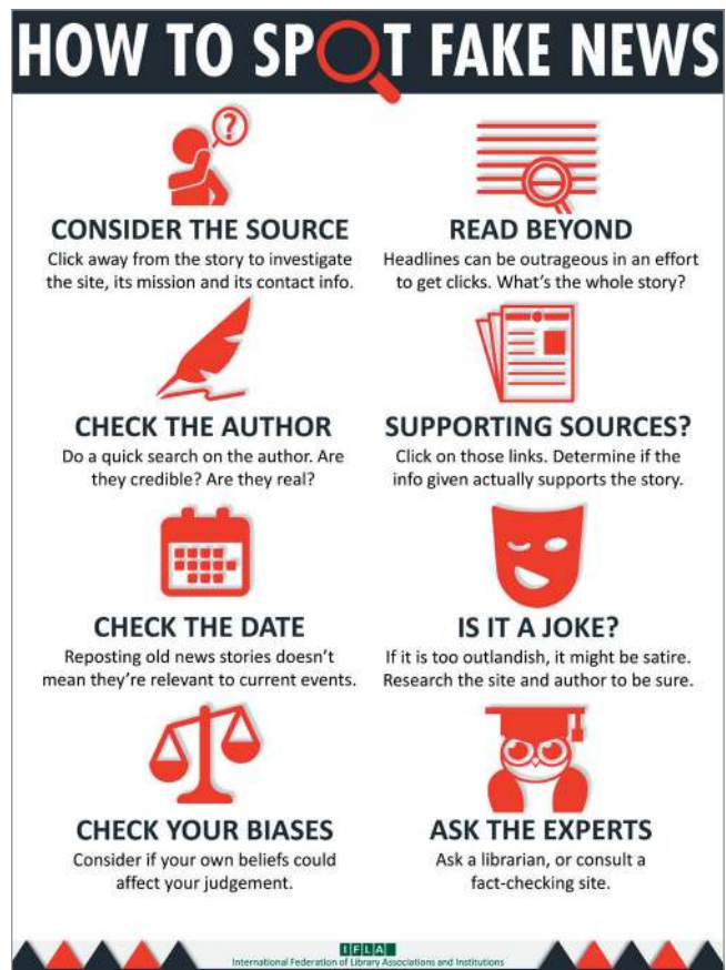
Gráfico 3. Infografía creada por la IFLA para luchar contra las fake news. https://www.ifla.org/publications/node/11174

Como apunta López-Borrull (2017), puede ser de gran utili-