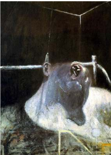
Imatge 5. Francis Bacon, Cabeza 1 , 1948.