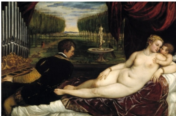
Imatge 3. Tiziano, Venus con el Amor y la música , 1548.