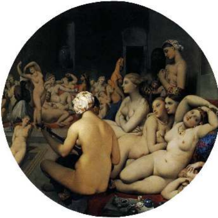
Imatge 4. Jean Auguste Dominique Ingres, El baño turco , 1862.