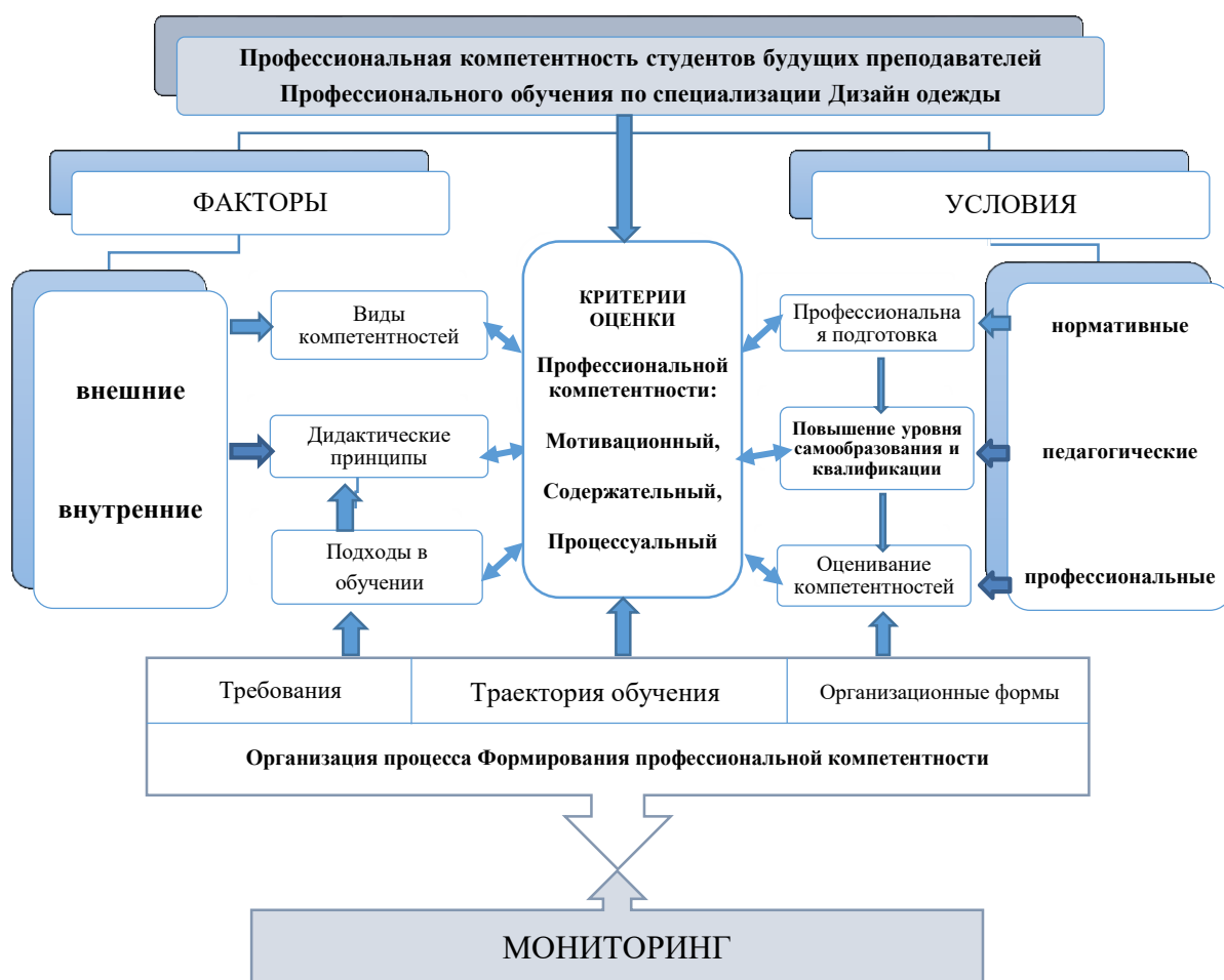
3. рис. Схема Модели Формирования профессиональной компетентности студентов будущих преподавателей Профессионального обучения по специализации Дизайн одежды