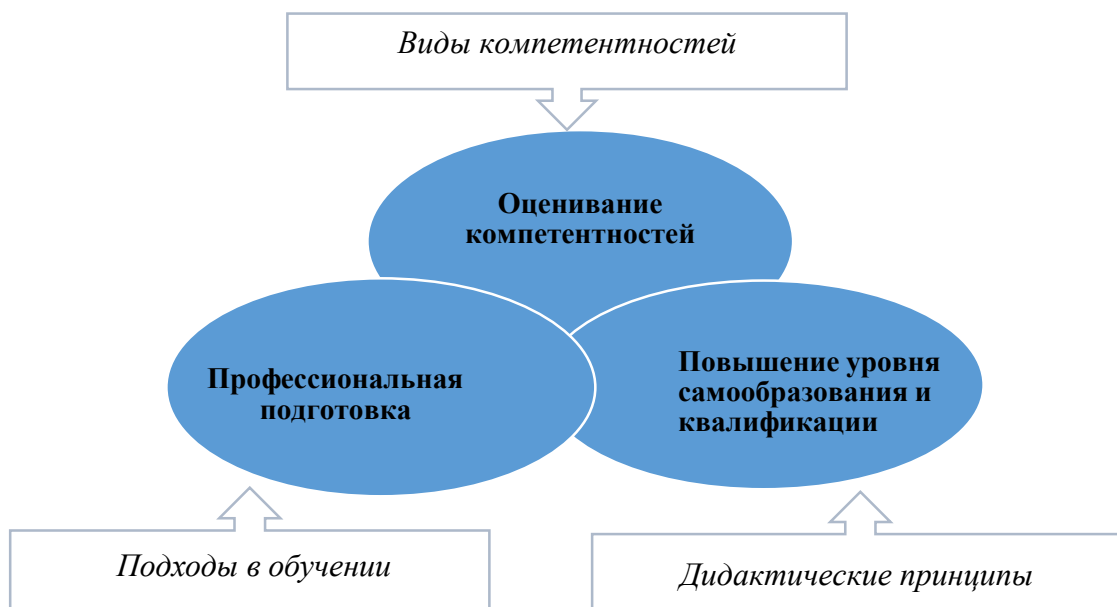
Рис. 2. Влияние компонентов Профессиональной компетентности на этапы Формирования профессиональной компетентности Fig.2 Effect of components of professional competence onto the stages of Formation professional competence

Три этапа Формирования профессиональной компетентности будущих преподавателей: оценивание компетентностей, профессиональную подготовку, повышение уровня самообразования и квалификации (см. рис. 2).