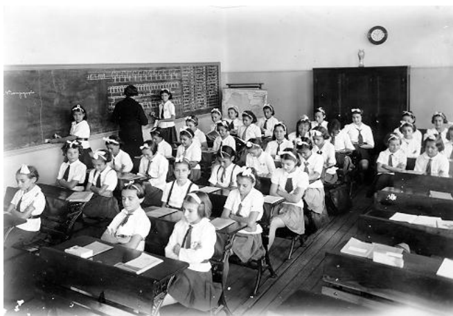
FIGURA 13-AULA DE LÍNGUA PORTUGUESA, SEÇÃO FEMININA GRUPO ESCOLAR OROZIMBO MAIA, 1939.

abaixado, poucas meninas se atrevem a olhar para a câmera fotográfica. A artificialidade da cena fixa, não obstante, o ideal de uma aula de língua pátria.