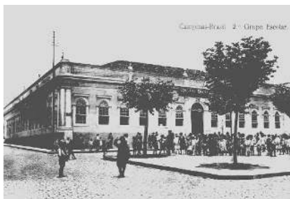
FIGURA 2-CARTÃO-POSTAL: 2º GRUPO ESCOLAR DE CAMPINAS, GE DR. QUIRINO DOS SANTOS, DÉCADA DE 1900

que se articulava e se comparava com outros edifícios escolares e outras vistas de outras cidades e regiões. Portanto, a escola como cartão-postal tornava-se um símbolo de civilização.