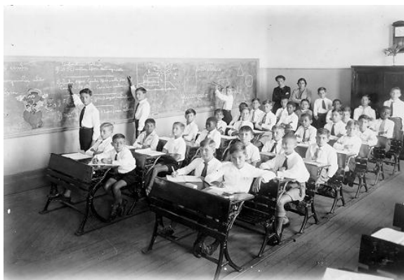
FIGURA 14-AULA DE MATEMÁTICA, SEÇÃO MASCULINA DO GRUPO ESCOLAR OROZIMBO MAIA, 1939.

A aula de matemática é retratada em outra classe da seção masculina. Três alunos estão no quadro negro resolvendo exercícios, um deles usa um grande compasso. No fundo da sala, em pé, a professora e sua auxiliar. Alguns