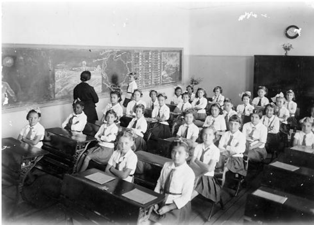
FIGURA 12-AULA DE GEOGRAFIA, SEÇÃO FEMININA DO GRUPO ESCOLAR OROZIMBO MAIA, 1939.

Numa seção feminina, o destaque é para a aula de geografia. A câmera flagra o olhar desatento das alunas que se voltam para ela enquanto a professora e uma aluna permanecem frente ao quadro negro totalmente desenhado.