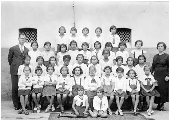
FIGURA 6-TURMA DE ALUNAS DO GRUPO ESCOLAR OROZIMBO MAIA, DÉCADA DE 1930.