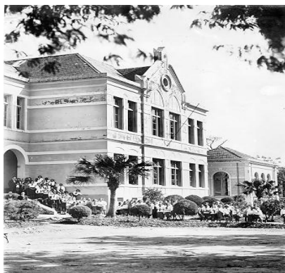
FIGURA 1-FACHADA DO EDIFÍCIO DO 1º GRUPO ESCOLAR DE CAMPINAS – GRUPO ESCOLAR FRANCISCO GLICÉRIO, DÉCADA DE 1940.