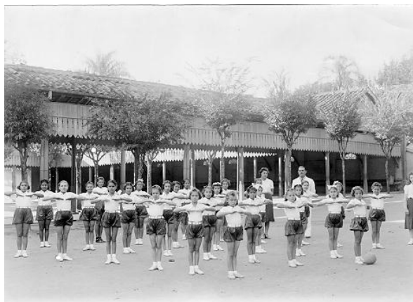
FIGURA 17-AULA DE EDUCAÇÃO FÍSICA, SEÇÃO FEMININA DO GRUPO ESCOLAR FRANCISCO GLICÉRIO, DÉCADA DE 1950.