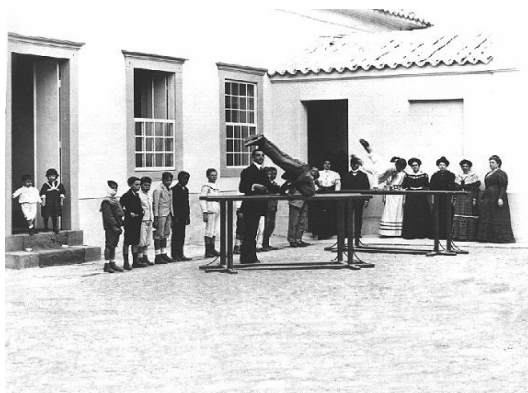
FIGURA 16-AULA DE GINÁSTICA, SEÇÃO MASCULINA DO GRUPO ESCOLAR FRANCISCO GLICÉRIO, DÉCADA DE 1900.

No acervo do Centro de Memória - Unicamp, na coleção do Instituto Agrônômico, encontra-se uma interessante imagem de uma aula de ginástica da seção masculina do Grupo Escolar Francisco Glicério (1º Grupo Escolar de Campinas) referente à década de 1900. Nessa coleção, encontram-se fotografias encomendadas pelos órgãos da administração pública para servirem de registro, de comprovação das obras e melhoramentos empreendidos pelo Estado. Essas imagens foram utilizadas também como forma de propaganda da ação oficial. Possivelmente, a fotografia mencionada tenha sido produzida com esta finalidade.