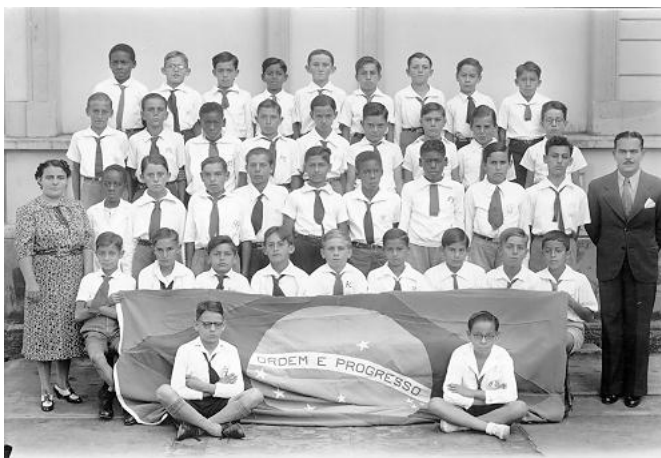
FIGURA 7-TURMA DE ALUNOS DO GRUPO ESCOLAR FRANCISCO GLICÉRIO, DÉCADA DE 1950.

A classe manifesta, também, a condição social homogênea do grupo e um padrão de comportamento ligados a um enquadramento moral. A origem operária e de setores populares é um traço da condição social dos alunos dos grupos escolares perceptível nas imagens. Os traços físicos e o vestuário são denotativos. Em algumas fotografias, crianças descalças aparecem na segunda fileira. Mesmo com a adoção do uniforme padronizado a partir da década de 1930, estas características permanecem.