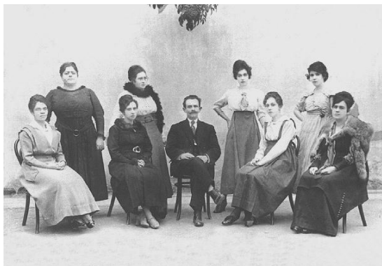
FIGURA 9-CORPO DOCENTE DO GRUPO ESCOLAR ARTUR SEGURADO, 1910.

O grande número de mulheres em relação ao reduzido número de professores do sexo masculino registra o que foi a composição do magistério primário no Brasil desde o final do século XIX. O diretor ocupa o lugar central na fotografia, reproduzindo na imagem as relações de poder prevalentes na organização escolar. O diretor, quase sempre do sexo masculino, até meados do século XX, reflete a divisão sexual do trabalho