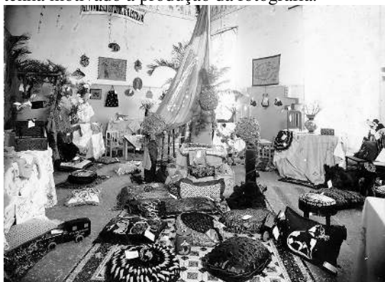
FIGURA 19-EXPOSIÇÃO ESCOLAR CONJUNTA DOS GRUPOS ESCOLARES FRANCISCO GLICÉRIO E BARRETO, DÉCADA DE 1930.

As fotografias de eventos escolares – festas, exposições e comemorações – são contributos para a memória institucional. Neste acervo, destaca-se uma imagem singular. Ela retrata uma exposição escolar, certames realizados anualmente nas escolas públicas destinadas à exibição dos trabalhos escolares, especialmente aqueles produzidos pelos alunos na disciplina Trabalhos Manuais. Trata-se, portanto, do registro de uma prática ritualizada. A realização conjunta da exposição pelos grupos escolares Francisco Glicério e o 6º Grupo Escolar de Campinas (Dom Barreto) talvez tenha motivado a produção da fotografia.