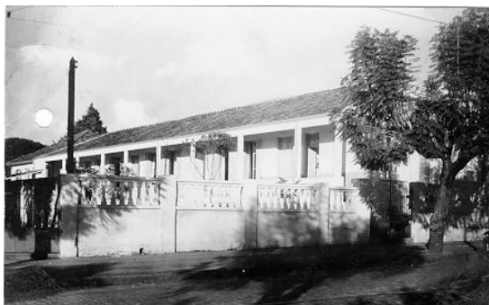
FIGURA 4-FACHADA DO EDIFÍCIO DO GRUPO ESCOLAR DOM BARRETO, DÉCADA DE 1950.

A partir de 1905, começaram a surgir em São Paulo os projetos de grupos escolares de um só pavimento considerados menos onerosos que as edificações anteriores. Alguns em forma quadrangular formavam um pátio interno em torno do qual erigia uma galeria de circulação coberta interligando as salas. Outros compreendiam apenas um bloco consistindo em edificações mais simples. Mesmo assim, apesar da perda da monumentalidade, a arquitetura dos grupos escolares manteve a identidade desses estabelecimentos de ensino.