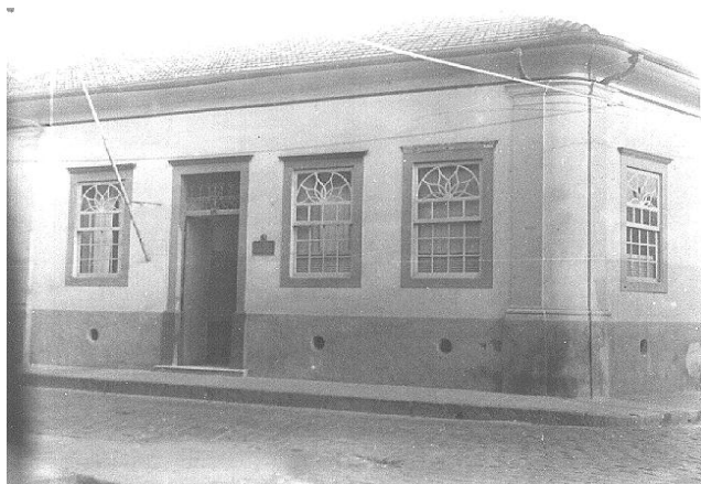
FIGURA 3-FACHADA DO EDIFÍCIO DO 3º GRUPO ESCOLAR DE CAMPINAS, GE ARTUR SEGURADO, DÉCADA DE 1930.