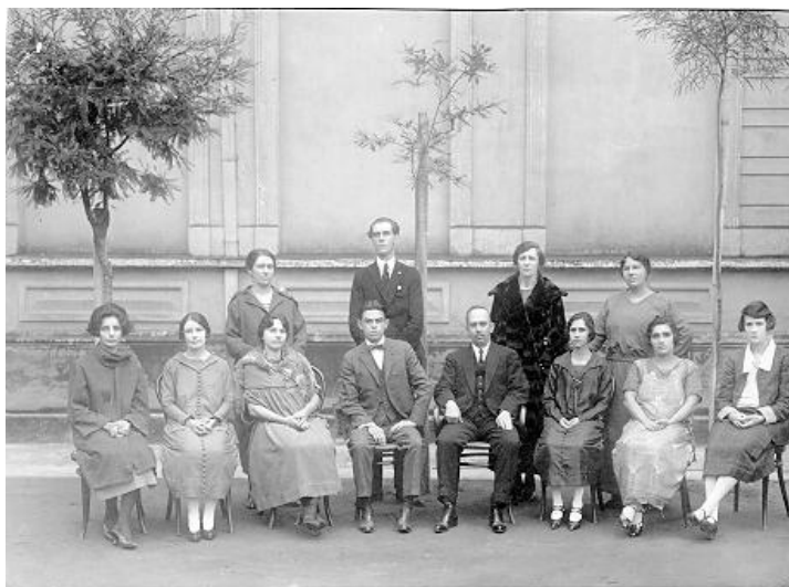
FIGURA 8-CORPO DOCENTE DO GRUPO ESCOLAR FRANCISCO GLICÉRIO, DÉCADA DE 1900.

No início do século XX, o magistério primário estava constituindo-se enquanto categoria profissional. O valor atribuído à escola pública dignificou a profissão docente e o professor passou a ser considerado o “apóstolo da instrução” – o profissional responsável pela mais nobre missão, isto é, a formação do cidadão republicano. Apesar dos baixos salários, ser professor ou professora era digno de respeito, reconhecimento, admiração.