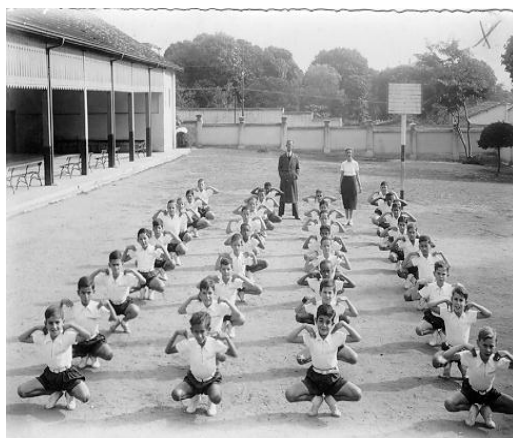
FIGURA 18-AULA DE EDUCAÇÃO FÍSICA, SEÇÃO MASCULINA DO GRUPO ESCOLAR OROZIMBO MAIA, DÉCADA DE 1950.