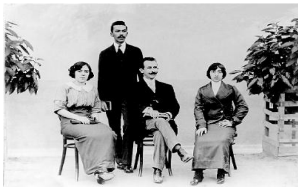
FIGURA 10-CORPO DOCENTE DO GRUPO ESCOLAR ARTUR SEGURADO, 1910.

O grande número de mulheres em relação ao reduzido número de professores do sexo masculino registra o que foi a composição do magistério primário no Brasil desde o final do século XIX. O diretor ocupa o lugar central na fotografia, reproduzindo na imagem as relações de poder prevalentes na organização escolar. O diretor, quase sempre do sexo masculino, até meados do século XX, reflete a divisão sexual do trabalho