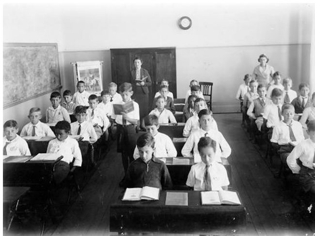
FIGURA 11-AULA DE LEITURA, SEÇÃO MASCULINA DO GRUPO ESCOLAR OROZIMBO MAIA, 1939.

As salas de aula são ambientes pouco retratados. Porém, foram encontradas no arquivo da EEPG Orozimbo Maia, cinco imagens reproduzindo atividades em sala de aula. A pose exagerada representa uma caricatura da disciplina escolar – braços para trás, postura ereta nas carteiras, olhar atento, silêncio.