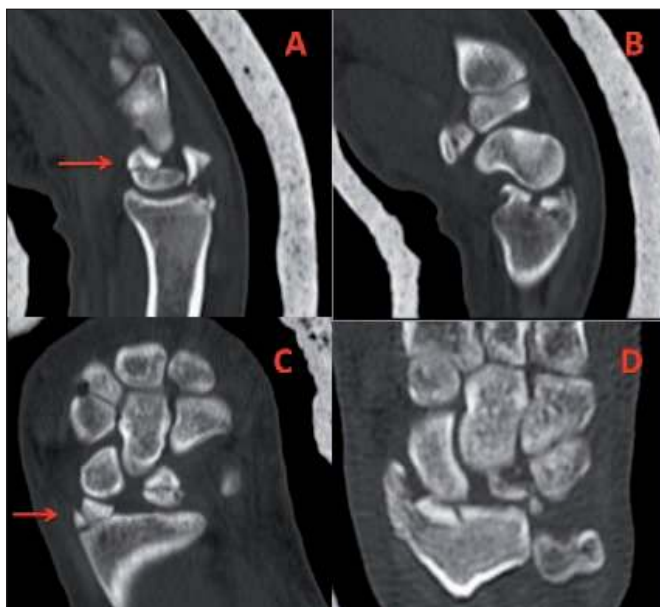
Fig. 2. Tomografía computarizada: A y B cortes en plano sagital en los que se aprecia fractura semilunar (A) y fractura de estiloides radial (B); C y D cortes en plano frontal en los que se aprecia fractura semilunar y estiloides radial con signos de lesión escafolunar.

El mecanismo de lesión en estos casos de lesión transemilunar no sigue el esquema descrito por Mayfield (3), aunque sí es una combinación de este concepto con una fractura del semilunar. En esta situación, una fractura del semilunar combinada con una rotura de los ligamentos