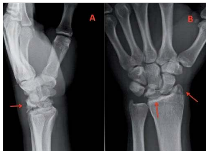
Fig. 1. Radiografías simples: A lateral y B anteroposterior, postreducción, en las que se evidencian las fracturas de la estiloides radial y del hueso semilunar.

Varón de 26 años de edad deportista profesional (jugador de fútbol) sin otros antecedentes personales de interés para el caso que nos ocupa. Sufró una caída durante