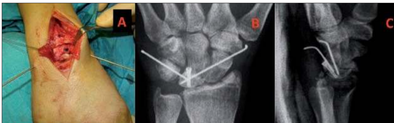
Fig. 4. A Imagen intraoperatoria con osteosíntesis del semilunar y artrodesis temporal. B y C radiografías anteroposterior y lateral a las 4 semanas de postoperatorio.