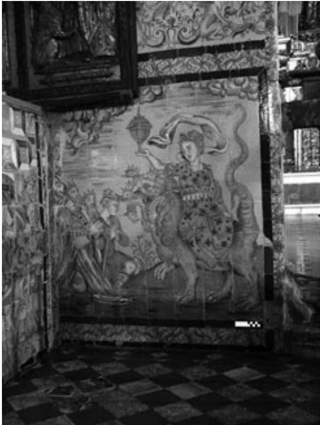
Fig. 4- Escena lateral de "Babilonia Criminal", junto al frontal de altar de la iglesia del convento Madre de Dios de Sevilla.