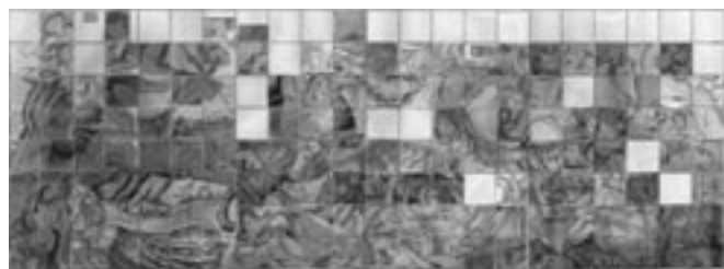
Fig. 13- Resultado de una reconstrucción virtual mediante fotografía digital y herramientas informáticas de la escena del frontal de altar donde se aprecian los Cuatro Jinetes del Apocalipsis. Están incluidos todos los azulejos hasta ahora localizados por los zócalos de la iglesia. Compárese el resultado con el frontal de altar original tal como se muestra en la Fig. 1 y, a escala similar, en la Fig. 5.

El resultado obtenido se presenta en la Figura 13 y se puede comparar con el original a escala semejante, mostrado en la Figura 5. El objeto de llevarlo a cabo ha sido de servir de