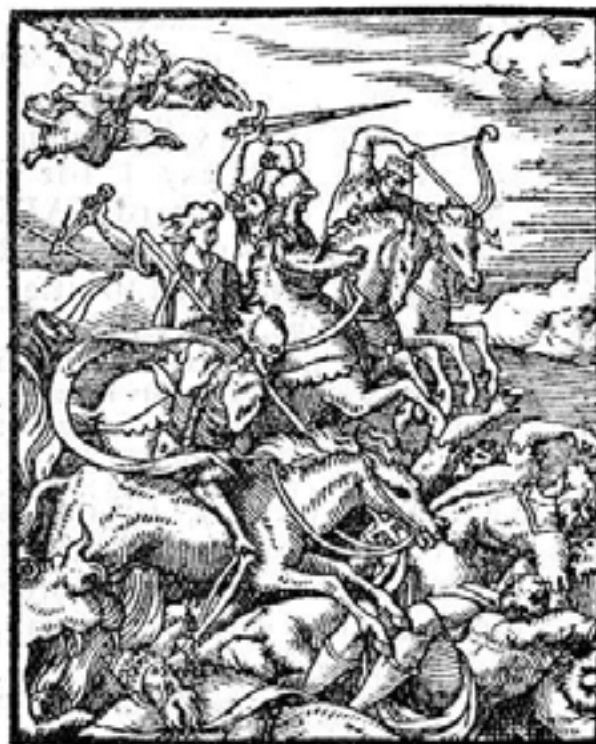
Fig. 12- Reproducción del grabado con la escena de los Cuatro Jinetes del Apocalipsis en la que, según Frothingham (3), se basó el autor del frontal del altar. Ilustraciones del Apocalipsis atribuidas a Bernard Salomón, publicadas en un volumen titulado "Figures du Nouveau Testament", en la ciudad de Lyon (Francia), año de 1554.

las causas principales de la alteración y permitirá, en suma, proponer el tratamiento más adecuado para una urgentísima intervención.