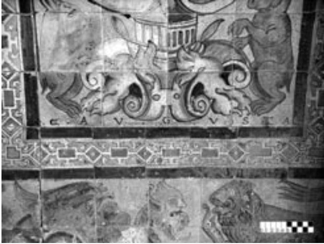
Fig. 8- Detalle del borde inferior de una estípite divisoria de los zócalos de los Reales Alcázares de Sevilla, donde aparece la inscripción AVGVSTA.

Sevilla, tal como se muestra en detalle en la Figura 7. En dicha obra aparece la firma "AV.GVSTA:FATI -1577" (Augusta Fati ¿ebat?). Existe un deterioro en esta obra (Fig. 7) que impide ver el final de la palabra "FATI ...", que podría ser "fatiebat".