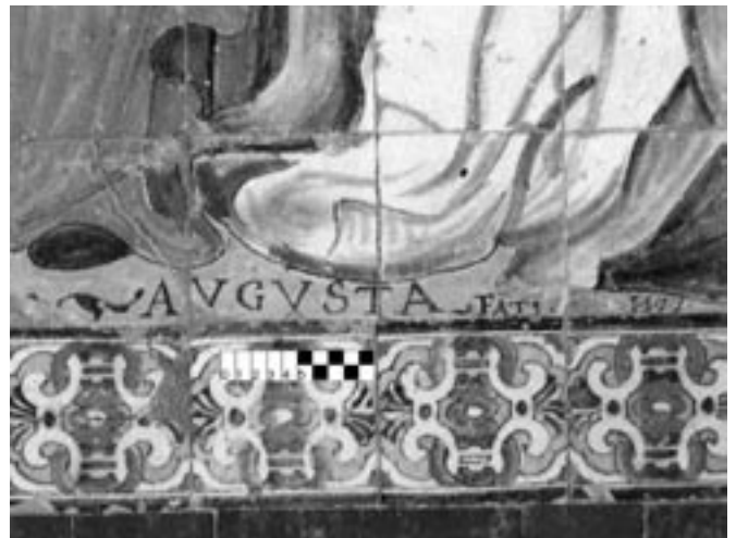
Fig. 7- Detalle de la inscripción con la firma del ceramista Cristóbal de Augusta que aparece en el panel cerámico de la Virgen del Rosario, fechado en 1577, resp. realizado para el convento de Madre de Dios en donde estuvo hasta 1868. Obra actualmente en el Museo de Bellas Artes de Sevilla.

El deterioro sufrido, por el espacio que presenta (Fig. 6), permite añadir las letras "TI", quedando entonces "AV.