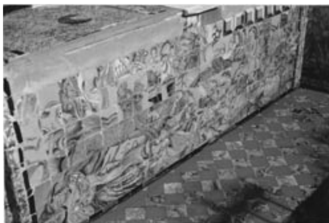
Fig. 1- Se muestra una perspectiva del estado del frontal de altar que se estudia en este trabajo y de parte de la solería más próxima a él, en la iglesia del convento Madre de Dios (Sevilla).

Al producirse la desamortización eclesiástica de 1868, en una parte del edificio conventual (claustro, refectorio y otras dependencias), se estableció la Escuela de Medicina, la cual permaneció transformada después en Facultad hasta 1931. A partir de este momento, la falta de vigilancia y el