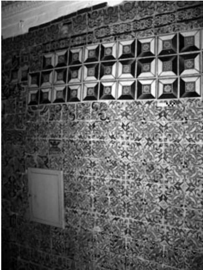
Fig. 2- Uno de los primeros ejemplos de cerámica polícroma plana posterior a Niculoso Pisano en Sevilla: zócalo de la Capilla del Correo de la iglesia del convento Madre de Dios, atribuida al Maestro Alonso García (1573).

Nota: Obsérvese en esta Figura la disposición de los azulejos en forma de estrella (con más detalle después en la Fig. 10) en relación a la distribución del mismo tipo de azulejos en el Peinador del Palacio de Velada, Talavera siglo XVI-XVII (estancia totalmente revestida de azulejería adquirida por el Museo de Cerámica de Talavera en 1972), como muestra la Fotografía de portada del Bol. Soc. Esp. Ceram. V. 33 [6] 1994, autor Domingo Portela (Asociación Amigos del Museo de Cerámica "Ruiz de Luna". Talavera de la Reina).