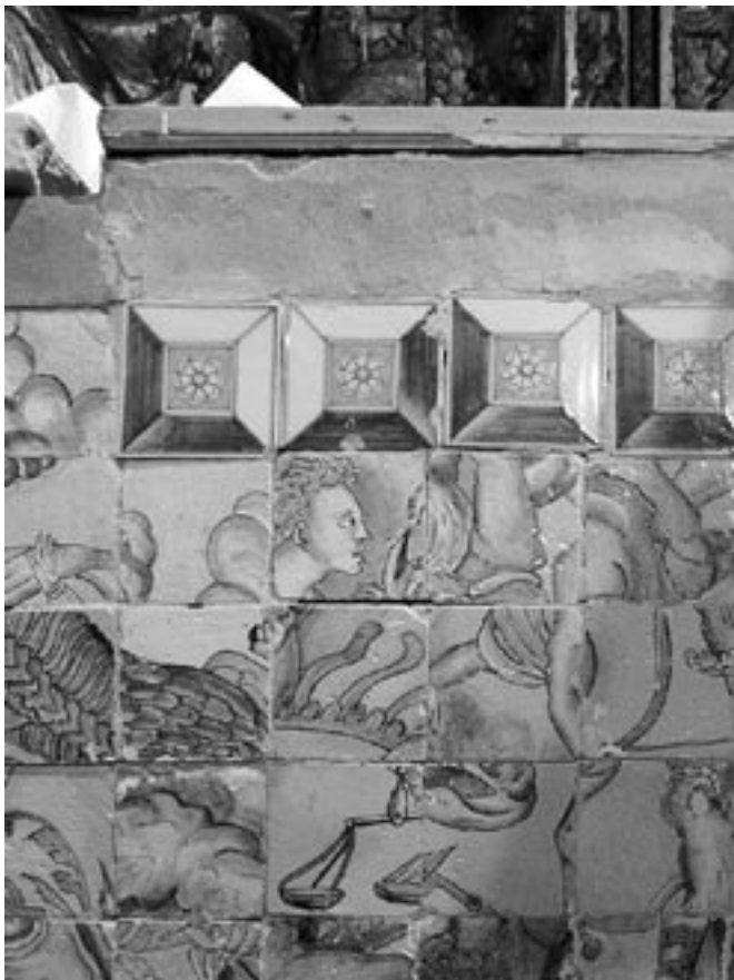
Fig. 10- Detalle ilustrativo del deterioro actual que presenta el frontal de altar dedicado a "Los Cuatro Jinetes del Apocalipsis" de la iglesia del convento Madre de Dios de Sevilla, con pérdidas del original e imposibilidad de visualizar y entender la escena representada debido a que los azulejos, en su mayor parte, están fuera de su posición original (véase el texto).

multitud de ellos. Ello ha provocado las pérdidas o roturas de las piezas y el desorden de los mismos, con deterioro a nivel estético. A título ilustrativo, se muestran varios detalles de los daños y deterioros en las Figuras 10 y 11. La degradación que ha sufrido esta obra ha sido constante durante los últimos cien años por haberse intervenido, además, con reparaciones parciales. Dichas reparaciones parciales no han buscado la eliminación de las causas de la degradación, sino que se han limitado a reponer piezas sueltas, así como a rellenar con mortero y otros elementos extraños las pérdidas de material. Esta falta de adhesión entre la pared del muro y los azulejos puede ser debida a distintos factores, como es una mala puesta en obra, además de una aportación de sales que trae consigo la humedad del suelo. Incluso podría deberse al envejecimiento de los morteros que provocaron una pérdida de su resistencia mecánica. De hecho, la humedad ha afectado a la obra con pérdida de cromatismo en los colores de las figuras y formación de halos blanquecinos, con origen en la migración de sales disueltas. El muro donde se encuentra también está afectado por agujeros, golpes y rozaduras, además de una capa de suciedad y pérdida de mortero.