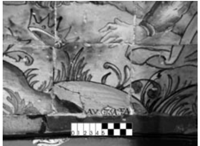
Fig. 6- Detalle de la inscripción en dos azulejos centrales del frontal de altar que, hasta esta investigación, ha pasado desapercibida a distintos especialistas que han estudiado esta obra cerámica en diversas épocas.

no encontró la firma del autor en los paneles cerámicos ("ninguno está firmado") y consideró que el contrato de esta obra pudo perderse en el incendio que destruyó el archivo del convento en 1598. No obstante, a pesar de no estar firmado, atribuyó el altar del Apocalipsis (Figura 6) al importante azulejero Cristóbal de Augusta (17).