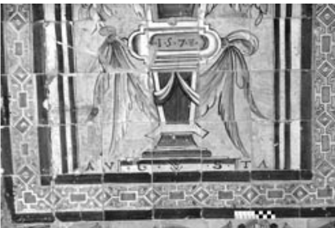
Fig. 9- Detalle del borde inferior de otra estípite divisoria de los zócalos de los Reales Alcázares de Sevilla, donde aparece la fecha de su realización (1578) y otra variante de la inscripción mostrada en la Fig. 8.

Todo lo anteriormente expuesto hace pensar que Cristóbal