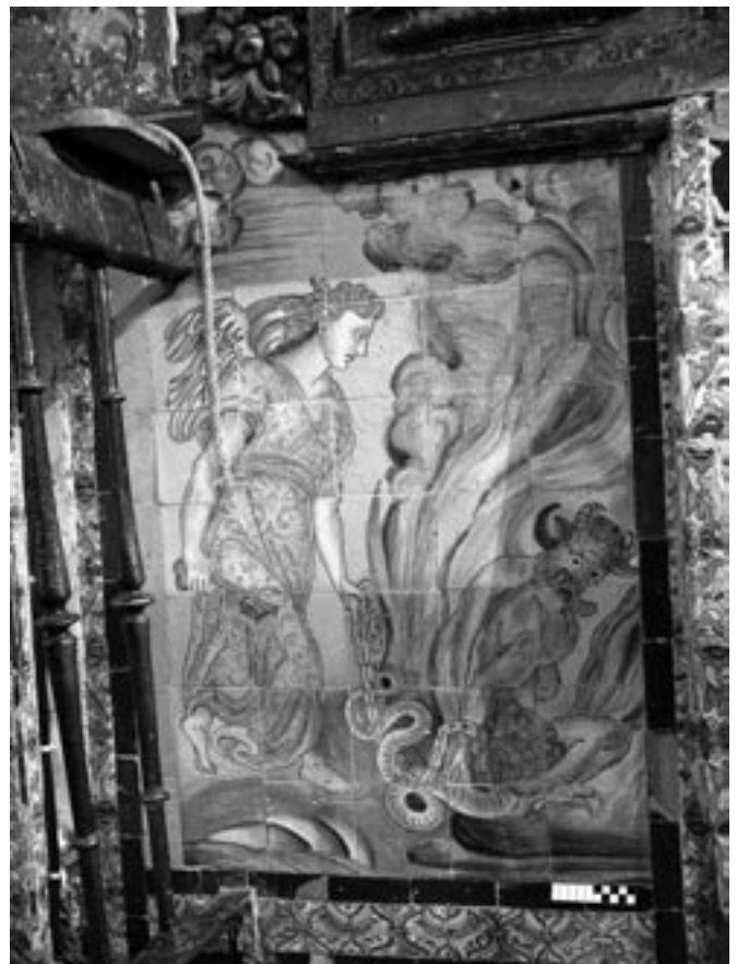
Fig. 3- Escena de "El Angel con la llave", junto al frontal de altar de la iglesia del convento Madre de Dios de Sevilla.

Para documentar esta obra, es imprescindible referirse a la investigación previa de Frothingham (3). Esta investigadora