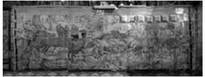
Fig. 5- Estado actual del frontal de altar dedicado a "Los Cuatro Jinetes del Apocalipsis" de la iglesia del convento Madre de Dios de Sevilla.