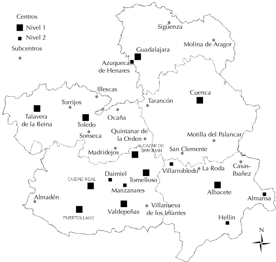
FIGURA 1. CENTROS Y SUBCENTROS DE CASTILLA-LA MANCHA. ESTUDIO PRELIMINAR