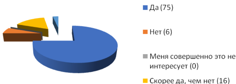
Рис. 3. Эффективность применения образовательного имидж-форсайта в ответах преподавателей (%)