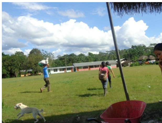
(Transporte del cacao en baba al centro de venta de Kallari)

económica. “Así se refieren a la autonomía económica, que definen como el derecho de las mujeres indígenas a tener acceso igual y control sobre los medios de producción [...]” (Hernández, 1999: 489). Las mujeres indígenas kichwas al igual que los hombres tienen derecho al acceso a la producción del cacao y otros cultivos de la chacra lo cual les otorga también la libertad de comercializar y administrar el dinero de la venta de modo autónomo.