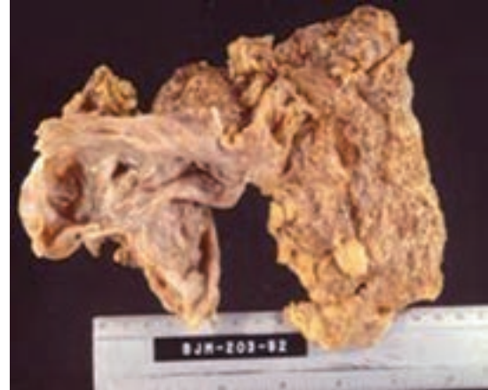
Figura 3. Pieza quirúrgica de 18 x 10 cm de diámetro con peso de 600 g, de consistencia blanda con múltiples quistes.

Los linfangiomas son lesiones extremadamente raras en la glándula mamaria, de comportamiento agresivo local, pero benignas. 12 Algunos