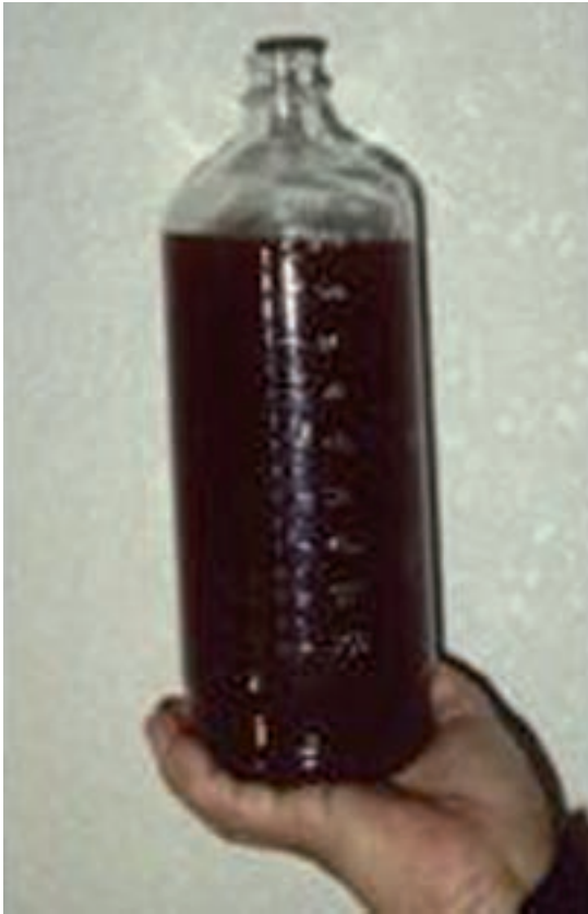
Figura 2. Contenido de la lesión puncionada; se extrajeron aproximadamente 1,200 mL de material serohemático, resultó negativo a BAAR.

El diagnóstico histológico definitivo fue de linfangioma quístico gigante de la glándula mamaria izquierda (Figura 4). En la actualidad, la paciente permanece en control clínico desde hace 20 años; a su condición de salud se agregaron cáncer de ovario y lipoma de hombro derecho, tratados; permanece viva sin recurrencias ni actividad tumoral (Figura 5).