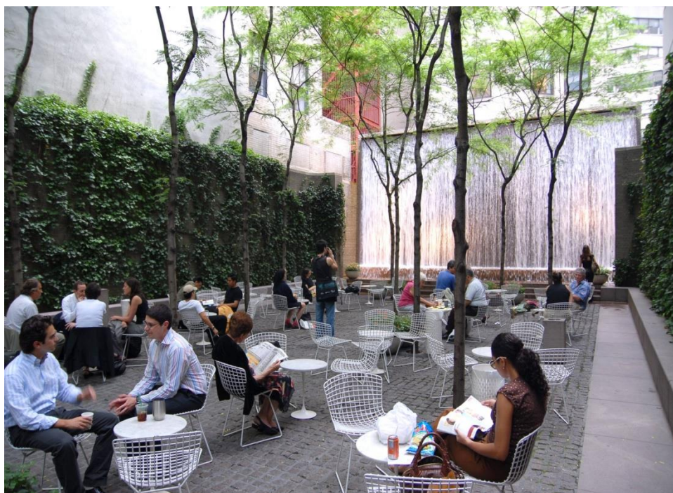
Figura 7 - Paley Park - Manhattan New York

È la Start-Up di un grande momento, di condivisione in luoghi e spazi dove prima venivano solamente utilizzati per spostarsi da una parte all'altra della città, luoghi di transito, sentirsi partecipi li rende parte integrante dell'evento, essere a casa, vedono gli artisti che si occupano dei loro spazi per renderli più