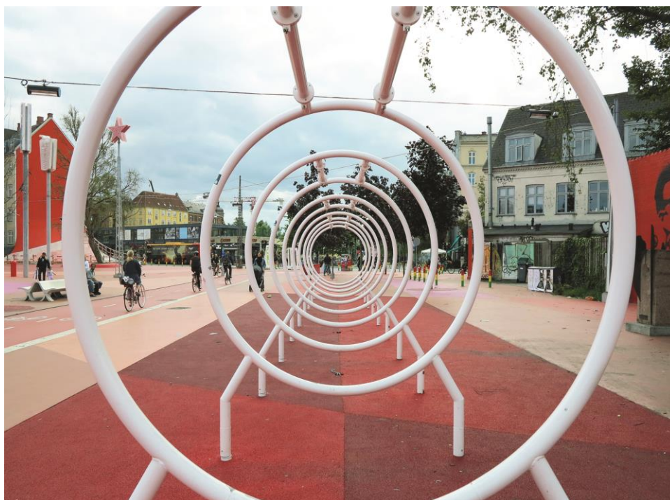
Figura 6 - Arcadia Parklet, San Francisco

Nel 2005 un gruppo di designers di San Francisco, i Rebar Studio , decidono di contribuire ad alleviare il traffico della città e l’inquinamento dovuto allo smog , per rendere le strade più belle e più accoglienti, stimolare le attività economiche e agevolare la socializzazione. Su un Pick-up , caricano un albero in vaso, un tappeto di prato naturale, una panchina e un cartello con la scritta: ‘accomodatevi, e godetevi dei momenti di relax in un micro-giardino lungo la strada’. Si dirigono verso un parcheggio, pagano la sosta per un’intera giornata, anziché parcheggiare il Pick-up creano un’installazione occupando due posti auto: stendono il tappeto di prato, posizionano l’albero, la panchina, il cartello e invitano i passanti alla sosta. Lo spazio tra il marciapiede e la strada diventa uno spazio ricreativo e di socializzazione per svolgere una pratica nobile all’uomo: l’incontro e la condivisione di un luogo. Un’area di confine, una dilatazione del marciapiede verso la strada per ritagliare una superficie dedicata ai pedoni e alla sosta: il Parklet .