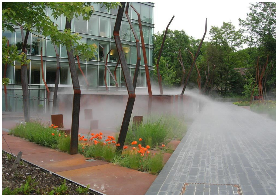
Figura 2 - Park on Route de Chene 2 with mist, Ginevra

Pertanto il paesaggio urbano condiziona in modo significativo l'umore e la qualità della vita, provocando un senso di benessere, di felicità, di angoscia, di ma-lumore. Uno studio condotto dal Federal Department of Housing and Urban Deve-lopment , Washington, degli Stati Uniti, ha dimostrato che alcune famiglie, resi-denti in quartieri popolari di Los Angeles, Boston, Baltimora e New York, do-po il trasloco in aree urbane più curate e più accoglienti, hanno da subito pro-vato una grande sensazione di felicità. Abitare in un luogo gradevole, dove so-no presenti parchi pubblici e verde diffuso, alberi e aiuole lungo le strade è molto più importante nelle grandi città dove i ritmi sono frenetici e congestio-nati perché la vegetazione ha una capacità di rigenerare l'aspetto psicologico degli individui, questo perché abbiamo una base biologica che ci induce ad in-staurare un contatto con la natura (D'aria, 2012). Questo non accade solamen-te per i residenti, ma anche per la gente che transita e si sposta all'interno della città. Quando si sceglie di percorrere una strada anziché un'altra per raggiunge-re il luogo prefissato le motivazioni possono essere di diversa natura e, chiara-mente, non sono solamente estetiche, come le quinte architettoniche che si af-facciano lungo la strada, ma la scelta può essere dettata da tanti fattori come