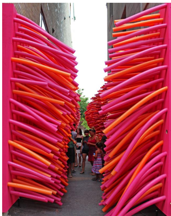
Figura 4 - Delirious frites, Quebec city

bellezza e piacevoli alla vista delineano un luogo costruito armonioso ed equilibrato dove il contesto fisico non basta, questa è la parte materica che soddisfa la vista, perché esiste un'altra parte che appartiene all'essere (Heidegger, 1960), nello spazio da solo e con gli altri, che sono i rapporti sociali, le relazioni che si creano con gli altri, in altre parole la divisione e la condivisione dello spazio tra le case.