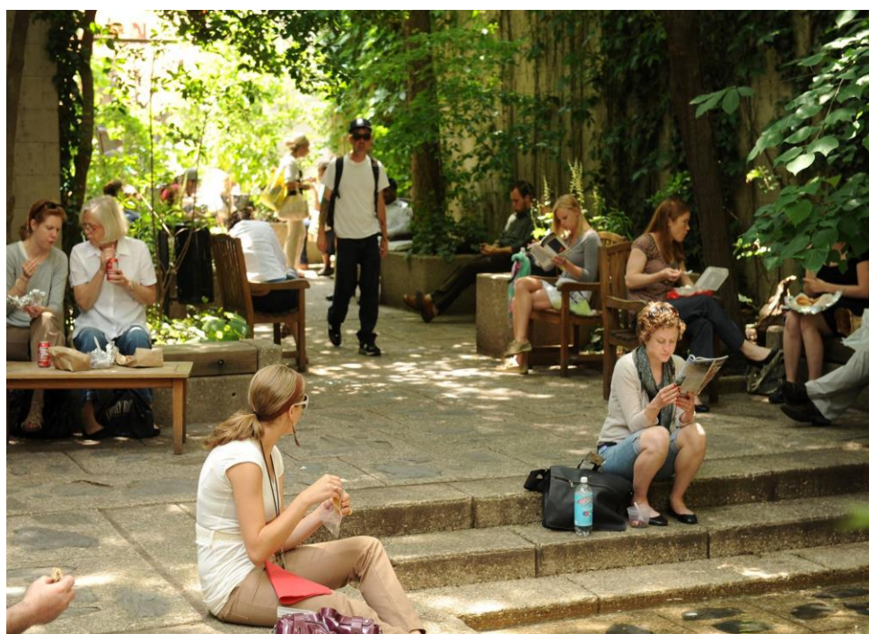
Figura 3 - Filadelfia john f. collins park pocket park intro

Il design negli ultimi anni si concentra proprio nell'individuare e nel sopprimere il 'germe' del non adattamento dello spazio urbano verso la gente, molti sono i progetti per rivitalizzare parti piccole del tessuto per riattivare il flusso energetico del vivere nei luoghi pubblici all'aperto, attraverso soluzioni rapide, micro-progetti che riequilibrano la fisicità dello spazio e della gente che lo abita.