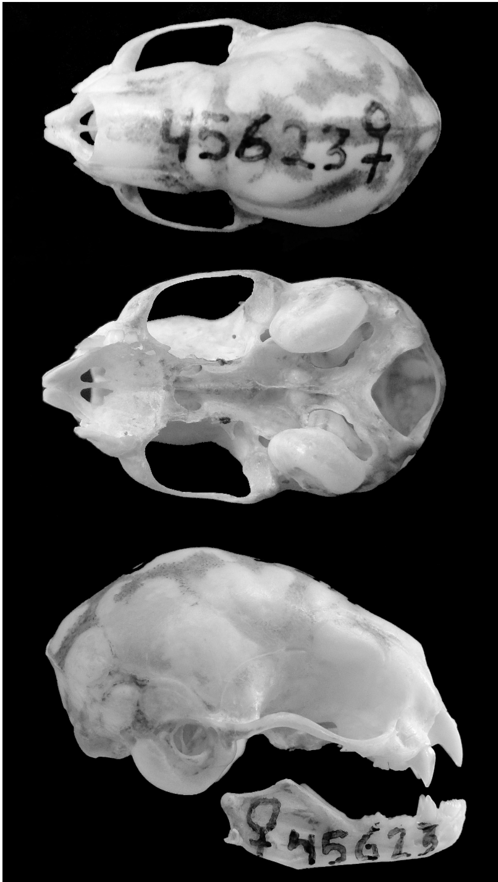
Figura 2. Vista dorsal, ventral y lateral del cráneo (longitud total de 21.96 mm) y lateral de la mandíbula de una hembra adulta de Diphylla ecaudata (C N M A - 4 5 6 2 3), procedente de 2.5 km NE Mesa Prieta, Guanajuato, México.