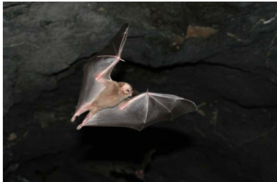
Figura 3. Diphylla ecaudata en vuelo en la mina abandonada "Majada", Guanajuato, México.