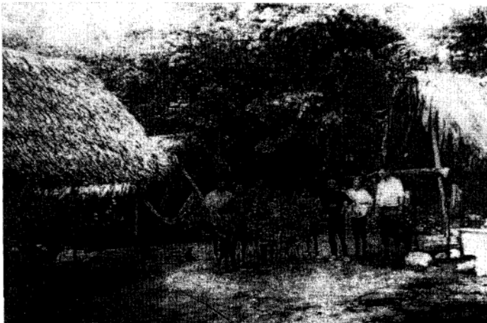
Figura 2 - Famílias de piaçabeiros e membros da equipe de pesquisa no acampamento.

Após cinco horas e meia em canoa, através de um igapó, orientados por um caboclo da área, chegamos às 17:30h a um acampamento onde se encontravam duas famílias de piaçabeiros (Figura 2). Em um piaçabal próximo ao local foi colocada uma armadilha de Shannon, visando a atração de