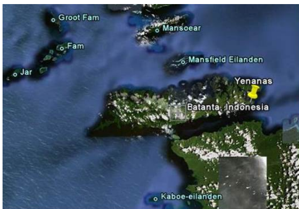
Gambar 1. Lokasi hutan mangrove di Yenanas, Pulau Batanta

Pengamatan di hutan mangrove Yenanas berhasil dibuat 6 transek, yaitu Transek 1 pada posisi S 0° 51' 0.6" dan E 130° 51' 43.4" dengan luas 600 m 2 ; Transek 2 pada posisi S 0° 50' 58.7" dan E 130° 51' 42.9" dengan luas 700 m 2 ; Transek 3 pada posisi S 0° 50' 33.7" dan E 130° 50' 50.7" dengan luas 1800 m 2 ; Transek 4 pada posisi S 0° 51' 9.2" dan E 130° 51' 11.0" dengan luas 1100 m 2 ; Transek 5 pada posisi S 0° 50' 9.6" dan E 130° 53' 12.4" dengan luas 2000 m 2