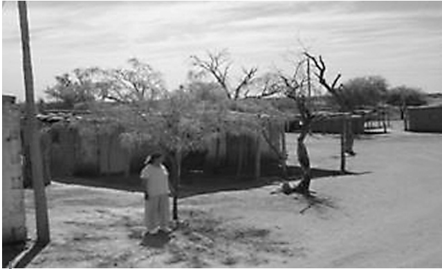
Figura 4 – Habitante de un poblado, descendiente de los huarpes

nacional e internacional. Las políticas del gobierno de la provincia destinadas a potenciar esta actividad se apoyaron en el patrimonio natural de la provincia pero también en una fuerte valorización de diversas formas objetivadas de la cultura mendocina, dentro de las que destacan las que se encarnan en sus paisajes culturales (tanto urbanos como rurales), en sus bienes ambientales, geosímbolos 3 y artesanías, así como también en las prácticas culturales específicas y distintivas de Mendoza (fiestas, vida cotidiana y cocina local). La valorización turística de los últimos años alcanzó a los viñedos y bodegas, al sistema de riego, a sus múltiples