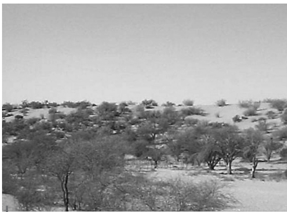
Figura 3 – Vegetación natural de las planicies no irrigadas del NE de Mendoza