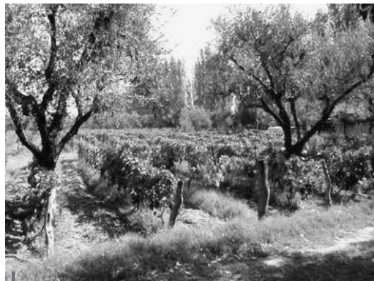
Figura 2 – Oasis del río Mendoza, viñedo tradicional

Sea comprando tierras vírgenes y construyendo bodegas, adquiriendo viñas y bodegas preexistentes ( take overs ) o —en menor medida— mediante alianzas con firmas locales, se instalaron en Mendoza desde principios de los años 1990 capitales vitivinícolas extranjeros, principalmente chilenos, españoles y franceses. Ya consolidados en el sector, buscaban —principalmente— tierras de calidad agroecológica relativamente baratas en un contexto de desregulación de la actividad. Merino (2001) señala que mientras que en términos de superficie plantada total la Argentina perdía casi 10 mil hectáreas entre 1995 y 2000 y Mendoza unas 3 mil, se plantaban en la provincia unas 30 mil hectáreas que representarían una inversión de 450 millones de dólares, justamente en momentos en los que los demás sectores de la economía mostraban indicadores de desinversión. La expansión provocada por los capitales extranjeros privilegiaba localizaciones en los altos piedemonte del Valle de Uco —en el centro oeste de Mendoza— que cambiaron su vegetación natural xerófila por proliferas hileras de viñedos tecnificados al tiempo que muchas viejas zonas vitivinícolas se degradaban en el marco de las malas performances económicas de pequeños y medianos productores al borde de la expulsión del circuito 2 .