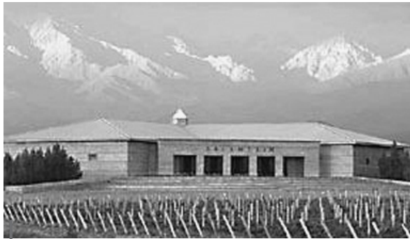
Figura 5 – Bodega de empresa extranjera en los piedemontes del valle de Uco

Para comprender los procesos socioterritoriales sobre los que se construyen las identidades, fue necesario reconocer las lógicas de diversos grupos sociales. A partir de un complejo mapa de actores de la Mendoza del presente (Montaña, 2003b), cuya centralidad ha sido deducida en el marco del papel que cada uno jugó en la construcción de las identidades y los territorios de Mendoza, se consideraron más significativos a los efectos de esta investigación los siguientes: