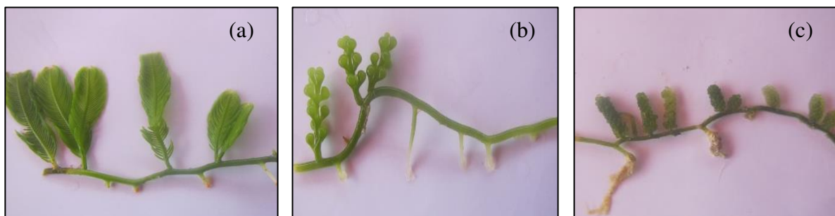
Gambar 2. Jenis anggur laut Caulerpa di perairan Natunaz: a) C. taxifolia , b) C. lentilifera , dan c) C. racemosa .

Berdasarkan pengamatan pada 8 stasiun penelitian di P. Bunguran, ditemukan 3 spesies dari anggur laut Caulerpa sp dengan sebaran yang berbeda antar stasiun. Jenis yang dijumpai di sekitar perairan P. Bunguran terdiri atas 3 spesies yakni Caulerpa taxifolia , Caulerpa lentilifera , dan Caulerpa racemosa (Gambar 2).