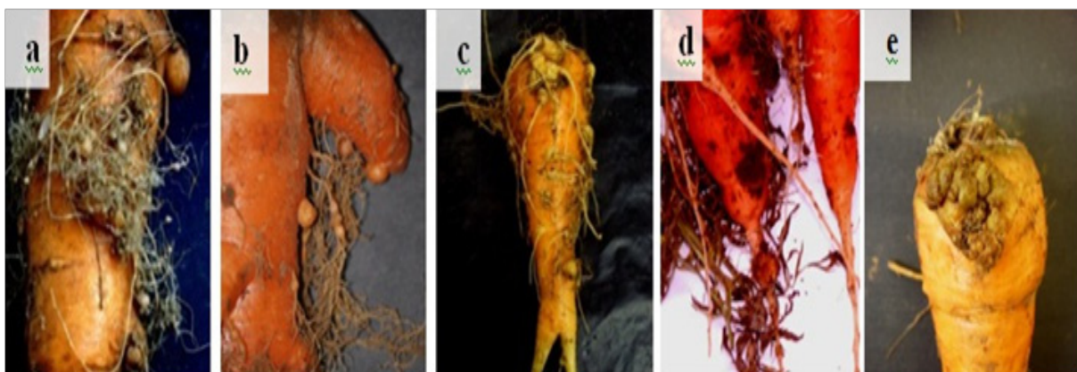
Gambar 2 Tipe puru pada perakaran wortel: a, puru bulat pada hairy root; b, puru bulat berukuran besar ( \pm 0.5 cm); c, puru memanjang; d, puru seperti kudis; e, puru seperti akar gada.