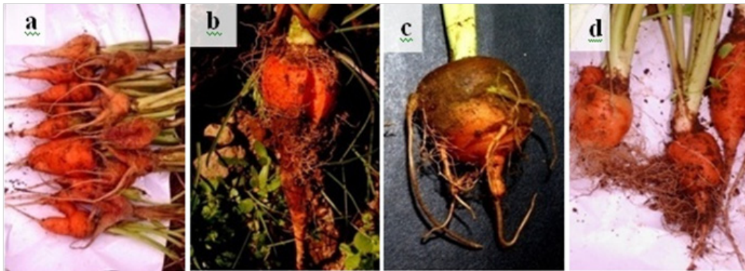
Gambar 1 Gejala umbi bercabang pada wortel dari Dataran Tinggi Dieng: a, umbi bercabang; b, umbi pecah; c, umbi pendek membulat; d, umbi berambut.