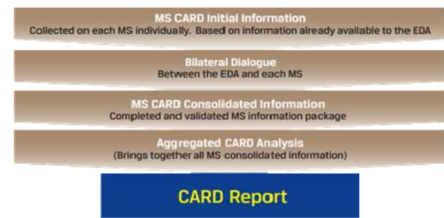
Slika 1 – Koraci u izradi izveštaja

Revizija bezbednosnih partnerstava EU – U zaključcima iz maja 2017. godine, Savet EU je ponovio svoju posvećenost razvoju „strateškog pristupa saradnje u okviru Zajedničke bezbednosne i odbrambene politike (The Common Security and Defence Policy – CSDP) 21 sa partnerskim zemljama“ u skladu sa tri strateška prioriteta EUGS-a „reagovanja na spoljne sukobe i krize“, „izgradnja kapaciteta partnera“ i „zaštita Unije i njenih građana“. Konkretnije, Savet je pozvao na razvoj saradnje CSDP-a sa partnerskim zemljama u oblastima koje nisu nužno deo operacija i misija CSDP-a. Ovo ima posebnu rezonanciju s obzirom na to da će Britanija postati treća država 2019. godine. Ključno pitanje za sve partnerske politike jeste prioritizacija partnera. Koje su to treće zemlje sa kojima EU treba da uspostavi partnerstva, i na osnovu kojih kriterijuma?