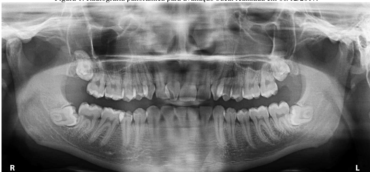
Figura 1: Radiografia panorâmica para avaliação bucal realizada em 06/12/2017.

Atualmente, o paciente se encontra assintomático, nega uso de medicação contínua e refere não ter sofrido nenhuma implicação bucal após o seu tratamento radioterápico para glioma de baixo grau (Figura 8).