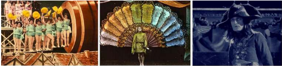
Figura 1. Viaje a la luna (1902, George Méliès); Le troubadour (1906, Segundo de Chomón); Napoleón (1927, Abel Gance).

de color han sido empleados desde el advenimiento del medio en las postrimerías de 1800” (Yumibe, 2012, p. 2). Las películas de cineastas pioneros como George Méliès eran coloreadas manualmente en talleres especializados, los cuales aplicaban el color “en determinadas zonas del fotograma, sobre la emulsión de la película, utilizando colorantes sintéticos, los cuales eran solubles en agua, transparentes y proporcionaban una amplia gama de colores, y siempre con la ayuda de pinceles muy finos” (Molina, Piquer, Cortina, 2013, p. 529).