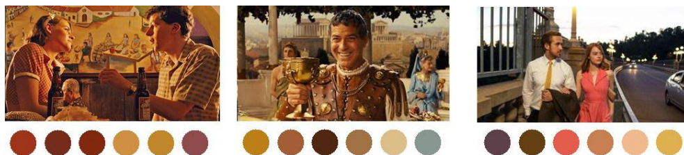
Figura 5. Café Society (2016, Woody Allen); Hail Caesar! (2016, Ethan y Joel Coen); La la Land (2016, Damien Chazelle).

El perfeccionamiento en el lenguaje de la dirección de arte o del diseño de producción permite ir más libre y sin ataduras investigando nuevas fórmulas y significados en el uso de determinados colores, texturas, formas, sumando en la actualidad las nuevas tecnologías en sus beneficios que permite un gran avance en el proceso creativo (García Navas, 2015, p. 97).