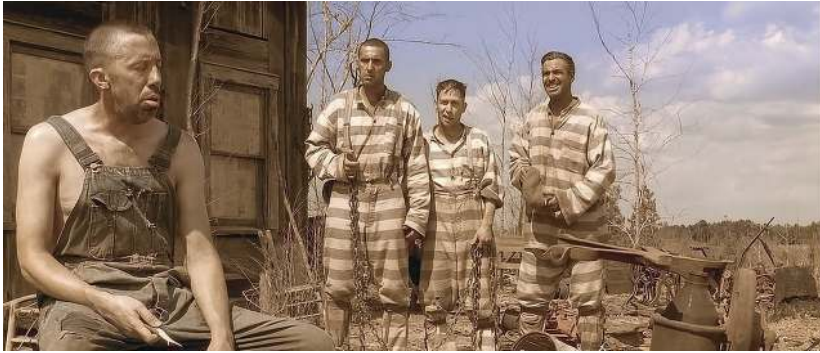
Figura 2. O Brother, Where Art Thou? (2000, Joel y Ethan Coen).

Después de tantos cambios en la concepción visual, cabe preguntarse si la transformación ha sido realmente radical a partir del advenimiento de la era digital, máxime cuando sabemos que el color se ha venido empleando con la misma funcionalidad desde el comienzo del cine, esta es, como “recurso expresivo transmisor de sensaciones en los espectadores” (García Navas, 2015, p. 242). Esto ha llevado a muchos autores a aseverar que el avance tecnológico solo “ha cambiado la calidad, y nada más” (Mitry, 1978, p. 43), a pesar de que para otros muchos, la implementación de mejoras digitales ha supuesto una auténtica revolución cromática. Veámoslo más detenidamente.