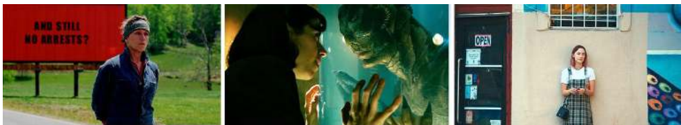
Figura 3. Tres anuncios en las afueras (2017, Martin McDonagh); La forma del agua (2017, Guillermo del Toro); Lady Bird (2017, Greta Gerwig).

Además del avance en la resolución de las pantallas (léase modelos LCD, LED, OLED, plasma, 4K, etc.), que invariablemente modifican la calidad de los colores en términos de nitidez, brillo, saturación y contraste, existen otros aspectos que hacen que los espectadores actuales muestren una mayor receptividad para los colores intensos, como es el acceso constante al universo virtual online , un entorno RGB de colores estridentes profundamente saturados. Como resultado, se da que el cine ha ido amoldándose paulatinamente a la estética y características físicas de las pantallas virtuales (televisión, ordenadores, smartphones y tabletas). Una plétora de variaciones tonales que ha inundado las pantallas, haciendo que la visión sea mucho más dada a la intensidad cromática.