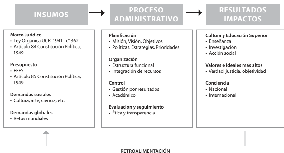
FIGURA 2 ENFOQUE SISTEMÁTICO ORGANIZACIONAL DE LA AUTONOMÍA UNIVERSITARIA