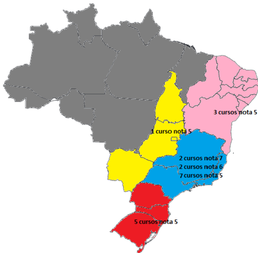
Figura 1 Distribuição regional dos cursos da área de administração

profissionais, está equilibrando este problema na região centro-oeste (CAPES, 2017c).