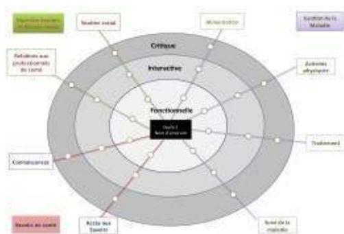
Figure 1 : étoile mettant en évidence les 8 variables et les 3 « niveaux »