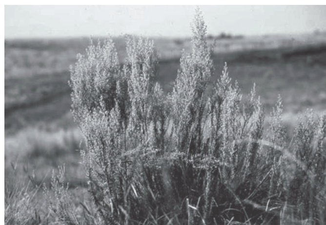
Fig. 1. Baccharis coridifolia é uma planta dióica que atinge altura de 50-80cm e tem folhas lineares de 1,5-5cm de comprimento. O período de brotação é a primavera e a floração ocorre no outono.

Baccharis coridifolia DC. (Asteraceae) é uma planta tóxica dióica (Fig. 1) que ocorre no Rio Grande do Sul, Santa Catarina, Paraná e São Paulo, onde é conhecida popularmente como "mio-mio", e