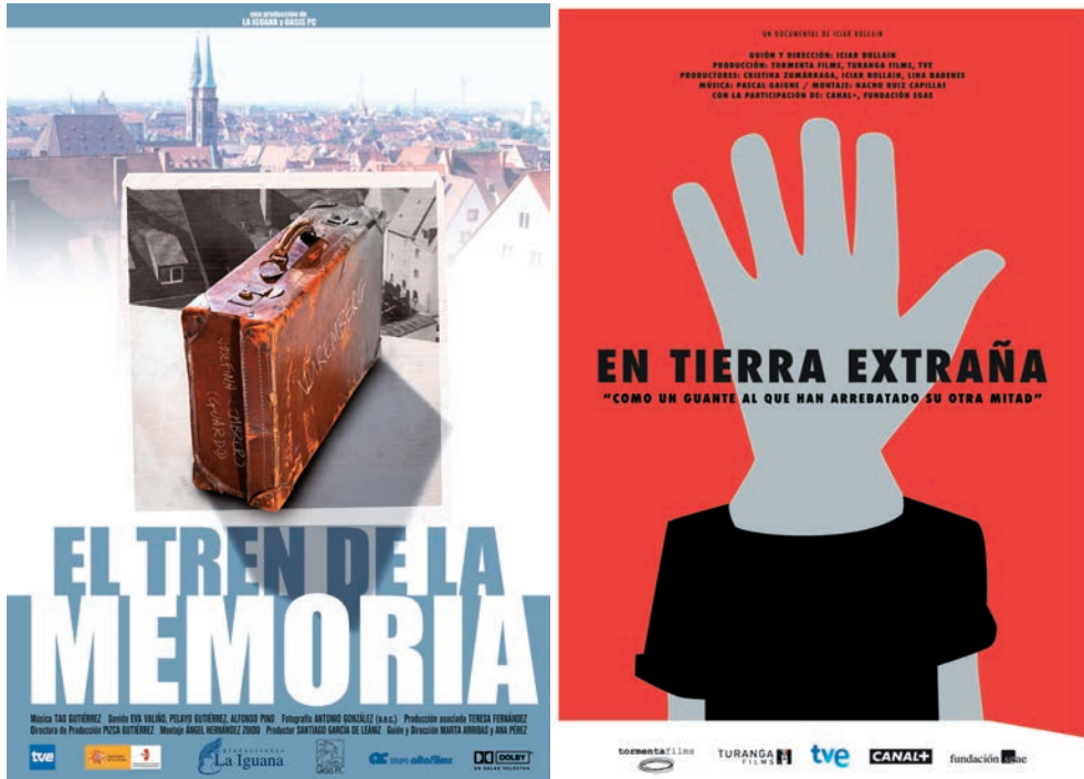
IMAGEN 1.—Narrativas cinematográficas de la emigración juvenil a Europa: El tren de la memoria (Pérez y Arribas 2005); En tierra extraña (Bollaín 2014).

territoriales, con un significativo peso de las grandes ciudades y de las clases medias y altas, abundan los títulos universitarios, viajan en aviones low cost , se comunican por Skype y Whatsapp, regresan a menudo a su lugar de origen, del que se mantienen informados a través de las redes digitales, y en lugar de enviar remesas pueden necesitar la ayuda de sus familias para poder mantenerse.