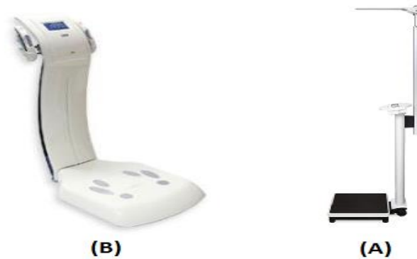
شکل ۱. (A) ابزار سنجش قد و وزن SECA (B) دستگاه تحلیلگر ترکیبات بدنی

نیز روایی محتوایی و صوری و پایایی قابل قبولی دارد (intra-class correlation > 0.7) [۲۲]. با تعیین امتیاز مقیاس‌های پرسش‌نامه IPAQ (پیاده‌روی، جسمانی متوسط و سنگین با استفاده از روابط ۱ تا ۳)، فعالیت جسمانی کل کارکنان (Total Physical Activity: PA total ) برحسب MET-min/week (۱ MET برابر است با میزان مصرف انرژی حین استراحت) تعیین شد.