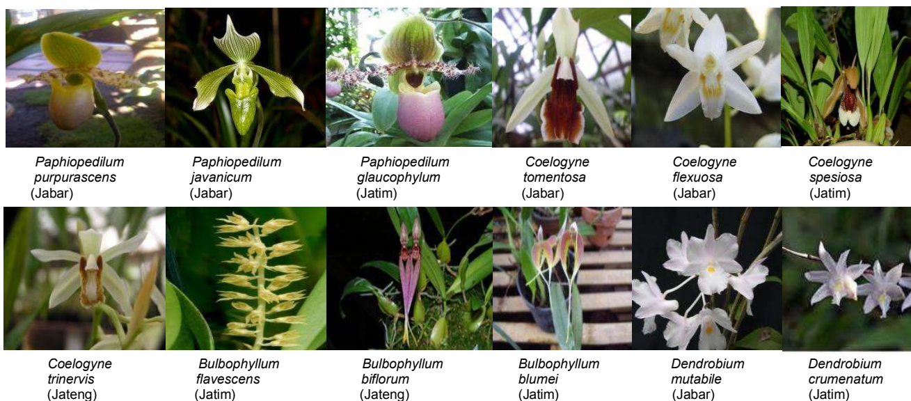
Gambar 1. Bahan tanaman 12 anggrek asal Jawa Tengah, Jawa Timur dan Jawa Barat.

Bermawie (2005) menyatakan bahwa karakterisasi merupakan suatu kegiatan dalam konservasi plasma nutfah untuk mengetahui sifat morfologi yang dapat dimanfaatkan dalam membedakan antaraksesi, menilai besarnya keragaman genetik, mengidentifikasi varietas menilai jumlah aksesi dan sebagainya. Batang anggrek diamati berdasarkan tipe pertumbuhan. Ada 2 tipe pertumbuhan anggrek yaitu monopodial dan simpodial. Batang monopodial merupakan batang yang memanjang ke atas dan hanya terdapat satu batang, sedangkan batang simpodial merupakan batang ke