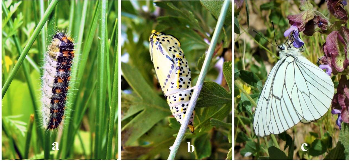
Şekil 2. Alıçbeyazı ( Aporia crataegi ) kelebeğinin yaşam döngüsüne ait aşamalar, a. Tırtıl (Larva), b. Pupa, c. Ergin birey, Fotoğraflar: E. Seven