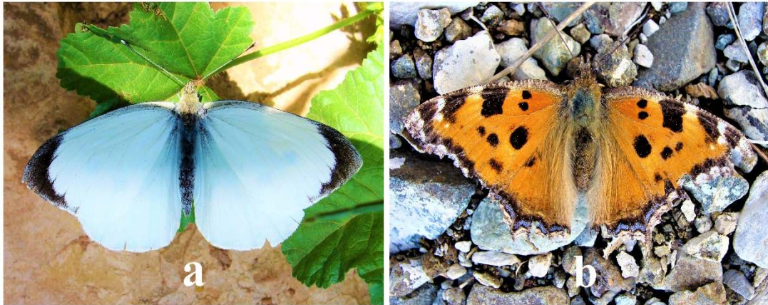
Şekil 5. Bazı kelebek familyalarındaki renklenmelere örnekler, a. Büyük Beyazmelek (Pieridae: Pieris brassicae), b. Sarı Ayaklı Nimfalis (Nymphalidae: Nymphalis xanthomelas)

Avrupa'daki önemli kelebek alanlarının belirlenmesinde, Van Swaay ve Warren (1999) kapsamlı bir temel oluşturacak bir araştırma yapmışlardır ve 21 milyon hektardan fazla bir alanı kaplayan (Avrupa'nın yüzölçümünün %1,8'i), 37 ülke ve üç takımada toplam 431 "Önemli Kelebek