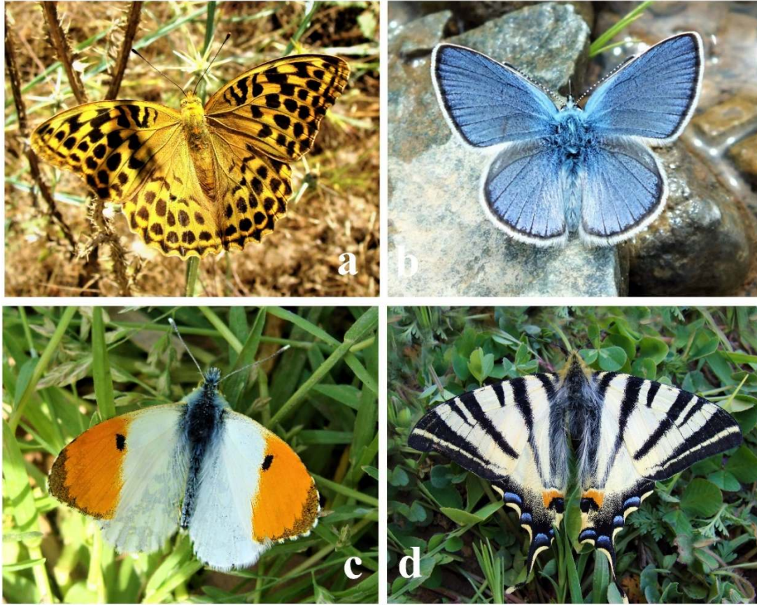
Şekil 1. Türkiye’deki Bazı Kelebek Türleri, a. Cengaver ( Argynnis paphia ), b. Çokgözlü Mavi ( Polyommatus icarus ), c. Turuncusüslü ( Anthocharis cardamines ), d. Erik Kırlangıçkuyruğu ( Iphiclides podalirius )

Omurgasız hayvanlar, dünya faunasının yaklaşık %90’ını temsil etmektedir (New, 1997). Omurgasızlar içerisinde de birey ve tür sayısı açısından en büyük grubu böcekler oluşturmaktadır. Kelebekler, böcekler (insecta) sınıfının pulkanatlılar (Lepidoptera) takımına ait hayvanlardır. Yaygın türlerle birlikte sadece belirli bölge veya alanları tercih eden (endemik) türleri de bulunmaktadır. Kelebekler bitki açısından seçici olduklarından yumurtalar uygun besin bitkisinin üzerine veya yakın bir alana bırakılmaktadır. Ergin kelebekler ise tipik olarak çiçeklerin nektarı ile beslenmektedir. Kelebekler tam başkalaşım geçiren canlılardır ve bunu yumurta, tırtıl (larva), pupa (koza) ve kelebek olmak üzere dört safhada gerçekleştirirler (Gullan ve Cranston, 2012) (Şekil 2). Bu gizemli ve büyüleyici yaşam döngüleri de dikkat çeken özellikleri arasındadır.