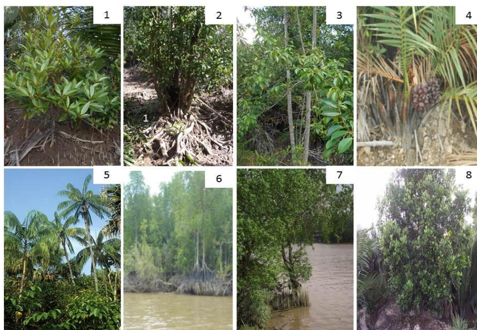
Gambar 2. Delapan spesies tumbuhan mangrove berkayu yang ditemukan di Kawasan HLAT (1. A. alba , 2. B. cylindrica , 3. E. agallocha , 4. N. fruticans , 5. O. tigillarum , 6. R. apiculata , 7. S. alba dan 8. X. Granatum ).

buah tersebut jatuh maka akan terbawa oleh arus dan akan menetap pada suatu tempat yang kemudian akan membentuk indukan baru. Sama halnya seperti N. fruticans yang memiliki buah yang banyak dalam bentuk tandan, dimana buah yang terjatuh akan terbawa oleh arus dan menetap pada suatu tempat yang kemudian buahnya akan bertunas.