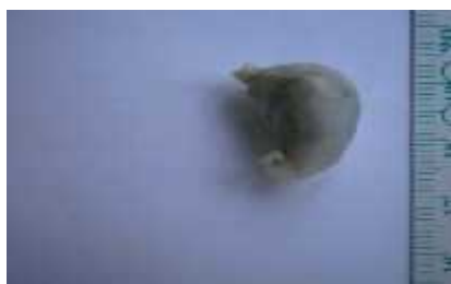
Gbr 2. Lambung Kodok