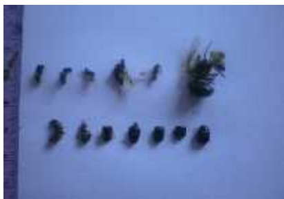
Gbr 1 Serangga di lambung

Keterangan : B. m : Bufo melanostictus ; B. a : Bufo asper