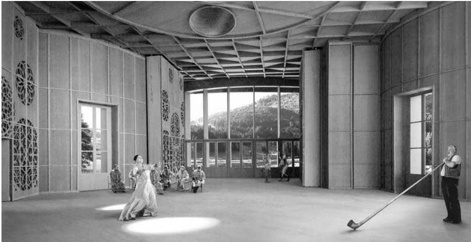
Abb. 1 und 2: „ArCAADia“ 47 : Idealisierte Klang-Kultur-Tourismus-Landschaft mit geplantem Klanghaus in Aussen- und Innenansicht.