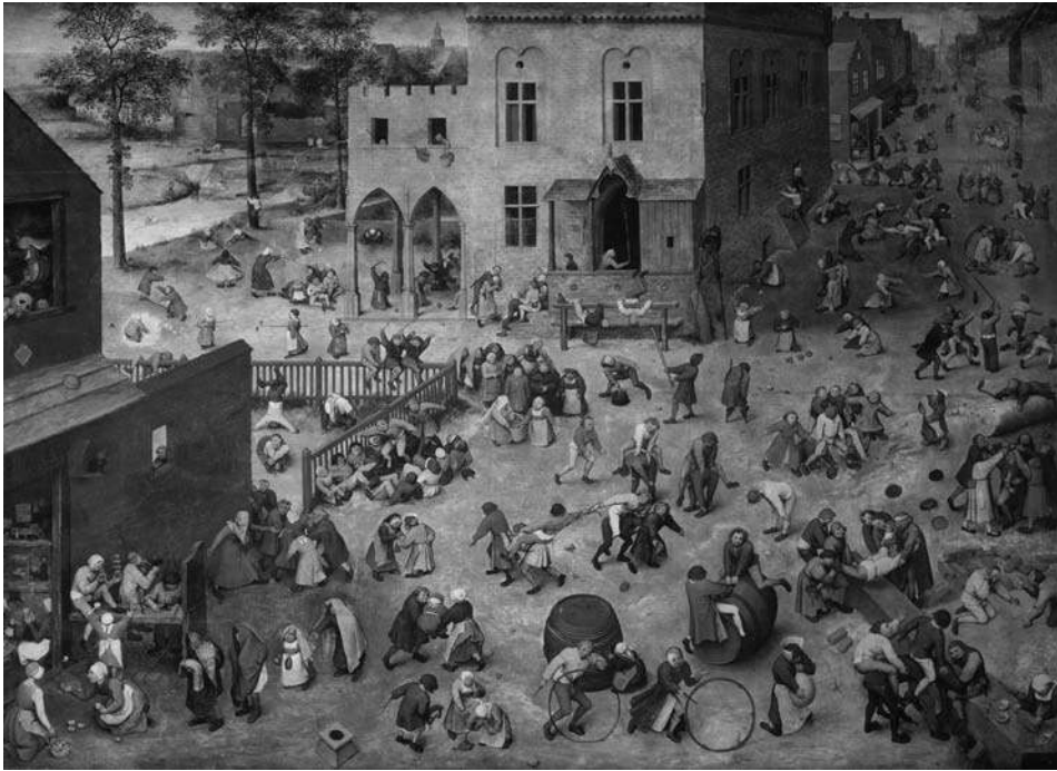
Abb. 2: Die Kinderspiele. Pieter Bruegel der Ältere, um 1560. 12

macht die Spiele zum Inhalt eines Kunstwerks, intendiert für den Kunstgenuss – auch dies ist eine kulturelle Praxis.