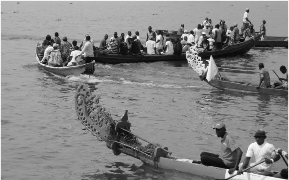
Abb. 2: Zwei Rennboote ( bolo ba pen) mit geschmückten Tange auf dem Wouri beim Ngondo 2012 in Douala vor Rennbeginn, 02.12.2013.