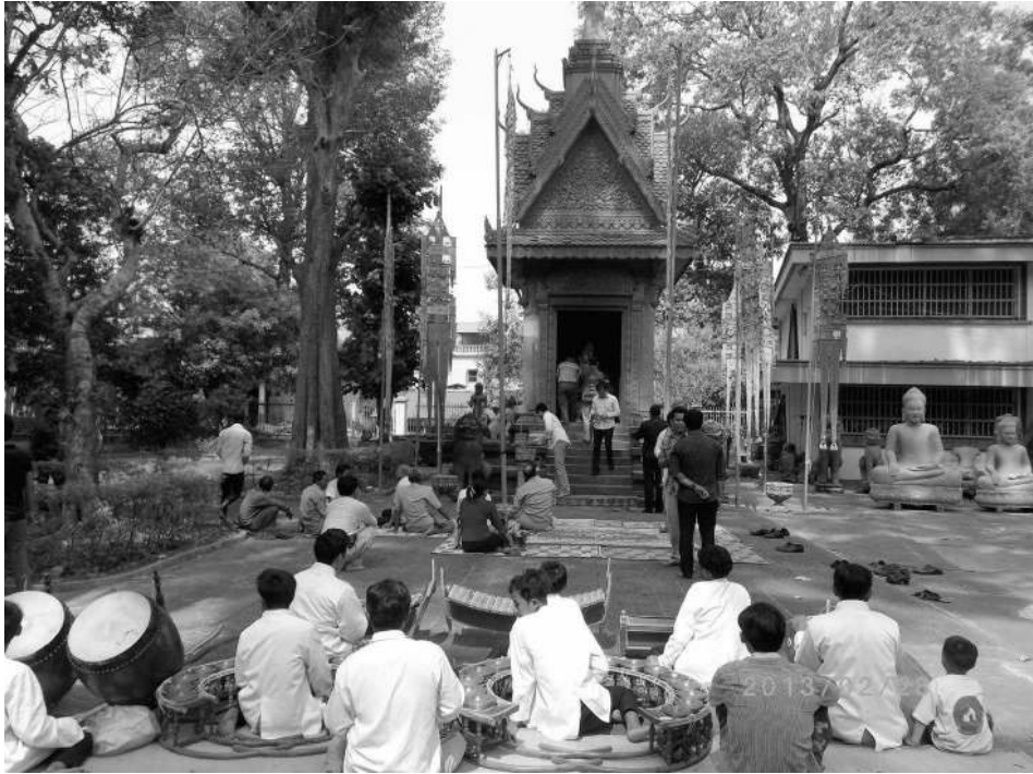
Fig. 2: Preah Kôk Thlok in the Angkor Conservation Office visited by Cambodian dignitaries (2013, Keiko Miura).

According to local informants and the staff member, the Khmer Rouge soldiers tried to destroy it with explosives made of landmines during the Pol Pot regime, but without success, though most other Buddha statues in Angkor Thom were damaged. This story of survival further enhanced the reputation of the potency of this Buddha statue. The present King Sihamoni also prayed to it. Since the gru 's identification of its potency, this Buddha has had a replica of the nâga covering attached to the back and was installed in an impressive shrine constructed especially for him (Fig. 2). Though there are many Buddha statues in the compound, this one receives the highest honours from dignitaries who visit to pray to it on special occasions. In fact, what can be seen at the vibear (temple hall) of Preah Kôk Thlok next to the Bayon temple today is a copy that also receives popular veneration.