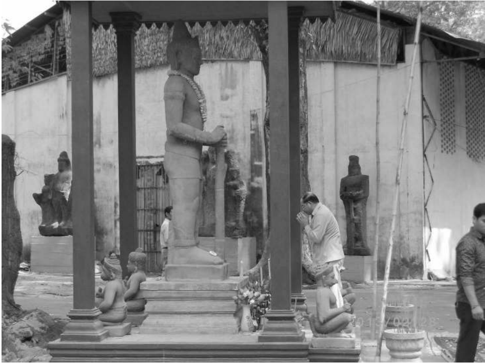
Fig. 3: The army general guarding Preah Vihear praying to original Tā Dâmbong Daek from Preah Khan (2013, Keiko Miura).

All the ancient temples have Dâmbong Daek statues guarding their gates, thus this neak tā is fairly popular, and many local mediums can be possessed by it during healing rituals.