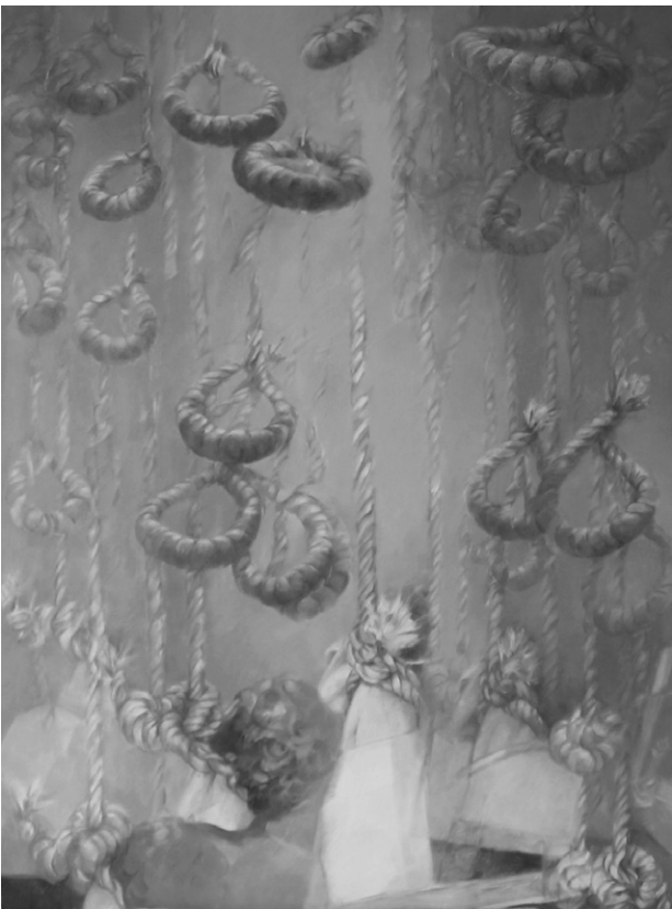
M. Lepeur, Ces cordés qui nous pendent au nez (2002), huile sur toile.

et des pulsions qui animent les familles des victimes. On pourrait penser, au premier abord, qu'il s'agit là d'une sorte de concession faite au camp adverse. On notera, cependant, que cette « concession » n'est pas faite du bout des lèvres : les orateurs clament haut et fort leur « compréhension » de la « douleur » et du « désir de vengeance » des familles des victimes. Le verbe « comprendre » paraît bien ici être le mot clé : on relève son occurrence dans trois des extraits [en 1), 3) et 4)]. Il se voit même renforcé, en 1), par un adverbe : il ne suffit pas de comprendre le désir « naturel » de vengeance des familles des victimes, encore faut-il le comprendre « parfaitement ». En 3), l'orateur fait mine de s'interroger : « Ai-je ici besoin de dire que je comprends et que je ressens la peine des victimes et de leurs familles et que je me sens très proche d'elles dans leur malheur ? » On a ici une question rhétorique, qui tend à la prétérition : elle suggère l'évidence et, par là même, la pleine légitimité d'une disposition affective qui, du coup, se passerait presque de mention explicite au sein du discours.