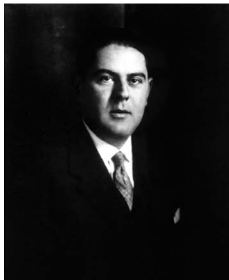
Pere Bosch i Gimpera.

Filólogo clásico y prehistoriador de formación, fue catedrático de Historia Antigua, decano de la Facultad de Filosofía y Letras y Rector de la Universidad de Barcelona (1933-1939). Entre 1937 y 1939 fue Conseller de Justicia de la Generalitat de Catalunya. En el año 1915 fue nombrado director del Servei d'Excavacions de l'Institut d'Estudis Catalans. En 1916 accedió a la cátedra de Historia Antigua de la Universidad de Barcelona. En 1919 publicó Prehistòria catalana (Bosch i Gimpera 1919). Dentro de su extensa producción escrita anterior a la Guerra Civil, en el año 1932, publicó un extenso volumen dedicado a la etnología, Etnología de la Península Ibérica , que tuvo un gran impacto y recibió elogiosos comentarios de su colega vasco José María de Barandiarán (Bosch i Gimpera 1932). Fue uno de los creadores de la Associació Catalana d'Antropologia, Etnografia i Prehistòria y en el año 1929 organizó el Congreso Internacional de Arqueología.