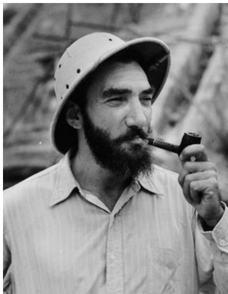
Pedro Armillas.

Desde 1940, ya matriculado en la carrera de Antropología en la ENAH, empieza a participar en excavaciones arqueológicas trascendentales, bajo la dirección de Alfonso Caso (Xochicalco, Teotihuacan, Monte Albán), aprovechando de nuevo sus conocimientos topográficos. Ya en el año 1945 sucede a su maestro, nombrado rector, en la Cátedra de Arqueología Mexicana, desarrollando una intensa tarea docente e investigadora. Al año siguiente obtiene una beca Guggenheim, que le permite viajar a los Estados Unidos y completar su formación como antropólogo. Allí, bajo la influencia capital de Paul Kirchhoff, queda atrapado por el enfoque del evolucionismo de Gordon Childe y de la ecología cultural. Los nuevos planteamientos de Armillas entran en conflicto con los intereses de sus mentores mexicanos, viéndose obligado a iniciar aquello que él mismo consideró su segundo destierro, ejerciendo como profesor en diferentes universidades norteamericanas, entre ellas, Michigan, Southern Illinois y Chicago. Mantuvo siempre contacto y amistad con Pere Bosh Gimpera y Joan Comas. Su obra, no demasiado abun-