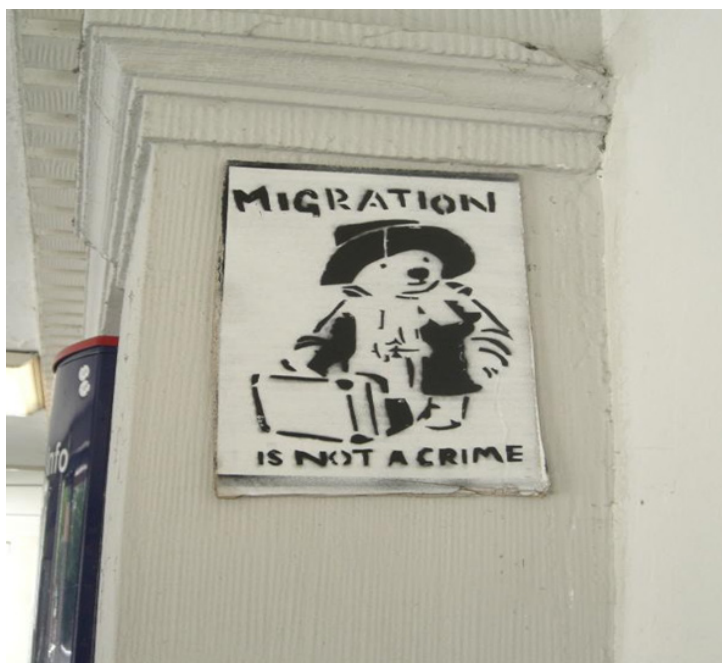
Figura 2. Grafiti callejero con la imagen del icono cinematográfico Oso Paddington , bajo el slogan “la migración no es un crimen,” April 2009 Lünen, Germany, Foto: mkorsakov. Flickr (CC BY-NC-SA 2.0)

Como punto de inflexión en esta presentación, analizamos el contexto histórico donde se planteó la interpretación de la migración con la lente de la autonomía. La autonomía de las migraciones constituye un cambio analítico innovador para conceptualizar la relación entre las vidas en movimiento y las prácticas de gestión migratoria. Es decir, la Autonomía de la Migración representa un giro relevante en los estudios migratorios clásicos descentrando el enfoque convencional: en vez de concentrarse en las “razones que explican las migraciones” o en “los controles migratorios” per se , el punto de interés se centra en la compleja