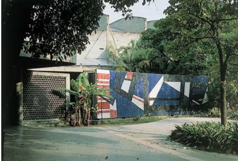
Figura 11. Mateo Manuare, mural al exterior de la Sala de Conciertos, Ciudad Universitaria de Caracas, ca. 1954.