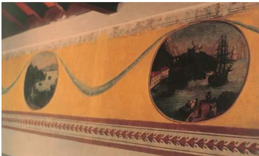
Figura 3. Pedro Castillo, cenefa con paisajes europeos, sala de las Aguas, Casa de Páez, Valencia, estado Carabobo, ca. 1830.

el sitio de Puerto Cabello, en la Quinta de Anauco, entonces residencia del marqués Francisco Rodríguez del Toro, atribuidas éstas a Hilarión Ibarra. 13 Ambas experiencias de pintura mural fueron realizadas alrededor de 1830.