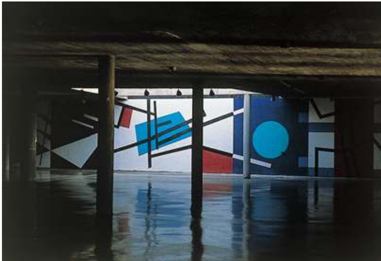
Figura 12. Mateo Manuare, mural en la Plaza Cubierta del Rectorado, Ciudad Universitaria de Caracas, ca. 1954.