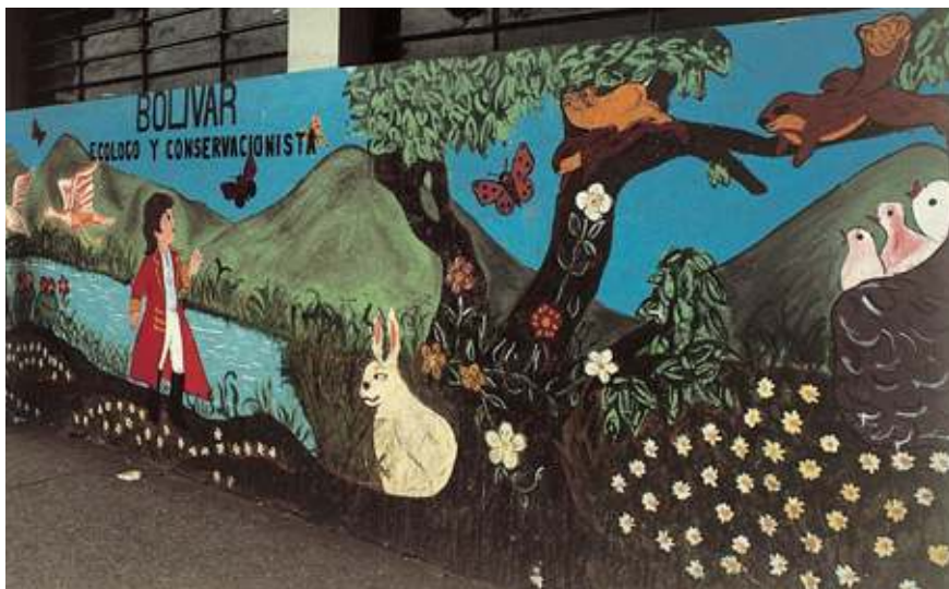
Figura 15. Anónimo escolar, Bolívar conservacionista , Avenida Lecuna, Caracas, 1983 (ya desaparecido).

do y bien pagado y hay cierta conciencia patrimonial que ayuda a su conservación: tiene dolientes.