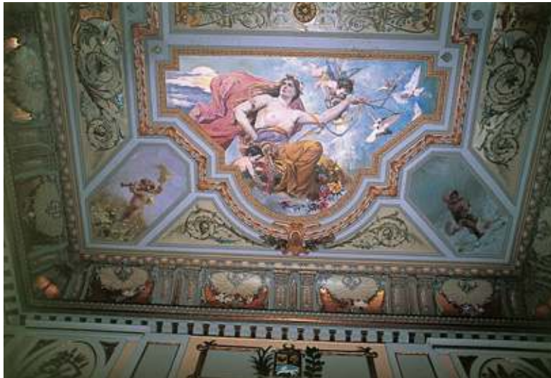
Figura 7. Arturo Michelena, La aurora , plafond de la sala principal del Palacio de Miraflores, Caracas, 1897.