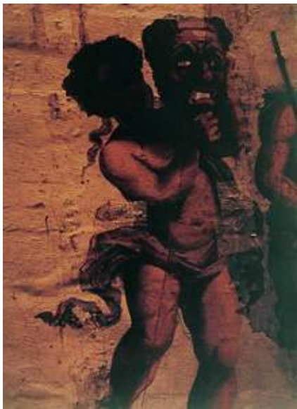
Figura 6. Taller parisino, La tragedia , detalle de la bóveda del Teatro Municipal de Caracas, 1876.

mano una corona de laurel. Completan la parte plana del techo, dos rectángulos pintados al estilo pompeyano, la parte que descansa sobre los muros está ricamente ornamentada con ramajes y emblemas propios de este salón, destacándose en medio de ellos y en ángulos cuatro cuadros que representan las Batallas de Carabobo, de Boyacá y de Junín, todas decisivas y que fueron mandadas personalmente por el Libertador; el cuarto cuadro representa una vista de la ciudad de Caracas con las fechas del natalicio y el Centenario de Bolívar. 19