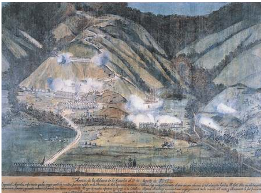
Figura 4. Pedro Castillo, Batalla de Naguanagua en 1822 , corredor de la Casa de Páez, Valencia, estado Carabobo, ca. 1830.

tendimiento” de la esposa de un hombre rico, con su amante, algo que al parecer había presenciado el pintor. El atrevimiento le costó la vida. 15