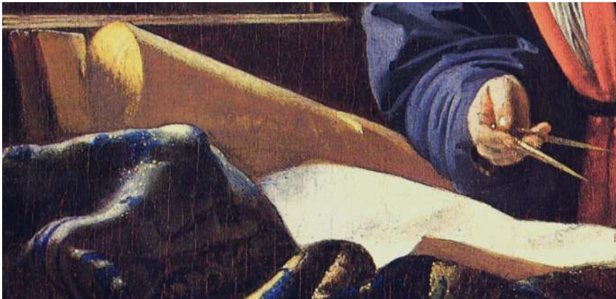
Figura 4. Jan Vermeer, El Geógrafo. Detalle.

Sobre la mesa, además del tapiz con casi el mismo objetivo que en el Astrónomo , encontramos objetos privativos de la geografía. Rollos de papel que, sospechosamente, nada muestran (escrito o dibujado), igual que el papel que vemos sobre el suelo [Fig. 4].