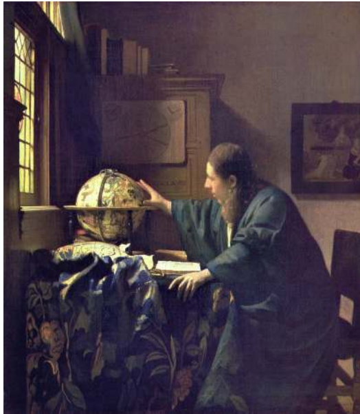
Figura 1. Jan Vermeer, El Astrónomo , óleo sobre tela, 1668.

Sobre la pintura de Vermeer se ha escrito bastante y variado. La razón de esta diversidad de interpretaciones y aproximaciones es resultado, en gran medida, de la ausencia de documentos escritos del propio pintor, y de la escasez de testimonios contemporáneos sobre su vida y obra. A esta ausencia de textos escritos se suma una prolífica producción visual que dejaron los artistas holandeses del siglo XVII, motivando la elaboración de interesantes hipótesis sobre su construcción, contenido y recepción. Para este trabajo nos centraremos en dos obras específicas: El Astrónomo (1668) [Fig. 1] y El Geógrafo (1669) [Fig. 2], dos de las únicas tres obras fechadas por el pintor (siendo la otra En Casa de la Alcahueta , de 1656), y usualmente consideradas como obras complementarias en fabricación y tema.