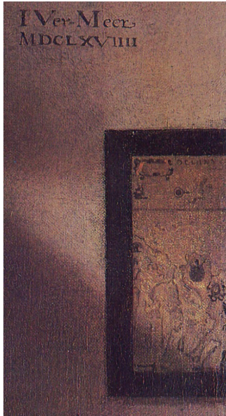
Figura 6. Jan Vermeer, El Geógrafo. Detalle.

Luego de describir detalladamente los objetos que se muestran en ambas obras, debemos mencionar aquello que, extrañamente, ocultan. Y esto es, justamente, lo que inicia nuestra problematización de las pinturas de Vermeer.