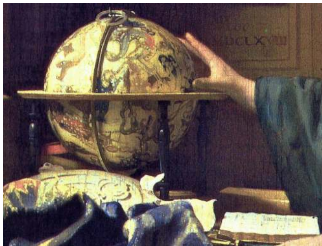
Figura 3. Jan Vermeer, El Astrónomo. Detalle.

Estos objetos corresponden a un libro abierto, un globo celeste y un astrolabio [Fig. 3]. Detrás de este último, hay más libros. El que está abierto sobre la mesa, se ha identificado como Sobre la Astronomía y la Geografía , de 1621, escrito por Adriaen Metius, abierto específicamente en el libro III “Relativos a la investigación o de la observación de las estrellas”, en cuya página izquierda aparece un astrolabio similar al que está debajo del globo celeste. El libro era destinado al profesional y aficionado como una guía práctica para el uso de instrumentos relacionados con el estudio de la astronomía y la geografía. La página abierta de este es la sección “Uno puede aprender a medir el cielo a través de ciertos instrumentos geométricos, de la situación que las estrellas tienen de acuerdo con su longitud y latitud”, que comienza con una breve discusión sobre los orígenes de la astronomía (Welu, 1986, pp. 263-267).