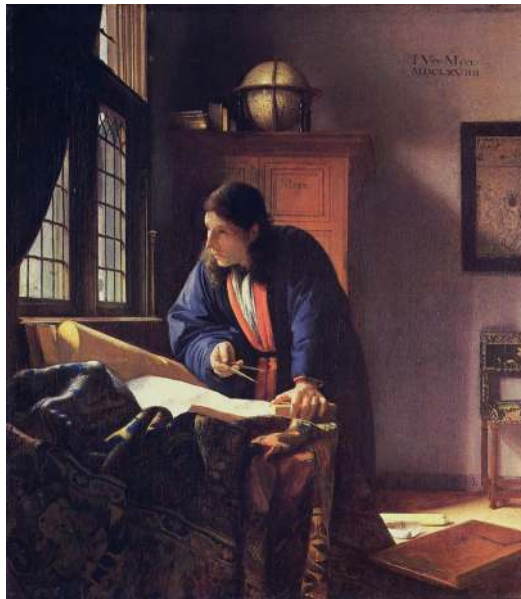
Figura 2. Jan Vermeer, El Geógrafo, óleo sobre tela, 1668-1669.

La ausencia de fuentes escritas del pintor y, en general, su escasez en la Holanda de este siglo, hacen posible y obligatorio un análisis casi puramente hermenéutico de las imágenes que se presentan, liberándose de la comprobación de las conclusiones en documentos escritos, como usualmente se hace. Por esta razón, en base al análisis de ambas pinturas en conjunto, estudiando los elementos compositivos que contienen y los objetos que representan, junto con la utilización de bibliografía académica sobre el pintor y el arte holandés del siglo XVII, se propone un estudio sobre los problemas que estos cuadros plantean al observador y las relaciones que pueden establecerse entre este, el pintor, y la imagen.