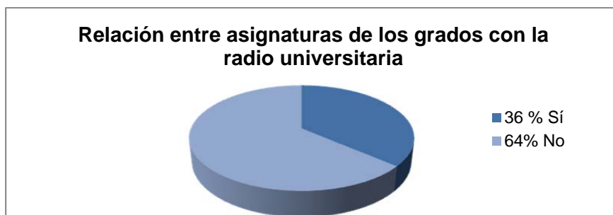
Gráfico 3. Relación asignaturas grados-radio

Para abordar el tercero de nuestros objetivos se hace imprescindible observar cuántas universidades que poseen radio universitaria ofertan el título de Grado en Información y Documentación. En este sentido, nos encontramos ante un 26% de radios universitarias adscritas a la ARU que se encuentran ubicadas en universidades que ofertan dicha especialidad (Complutense, Extremadura, Salamanca, Valencia, Zaragoza, León). Esta titulación, en la mayoría de los casos, suele ofertarse junto a alguno de los grados que ya hemos analizado (Comunicación Audiovisual o Periodismo), sólo con la excepción de la Universidad de León. Desgranando los planes de estudio de las seis universidades que forman parte de esta muestra; es decir, que ofertan Grado de Información y Documentación y poseen emisoras universitarias, y partiendo de la base de que no se localizan asignaturas con los vocablos locución, radio o variantes, hemos considerado como asignaturas específicas relacionadas en parte con la temática radio las que hacen referencia a la documentación audiovisual y/o informativa.