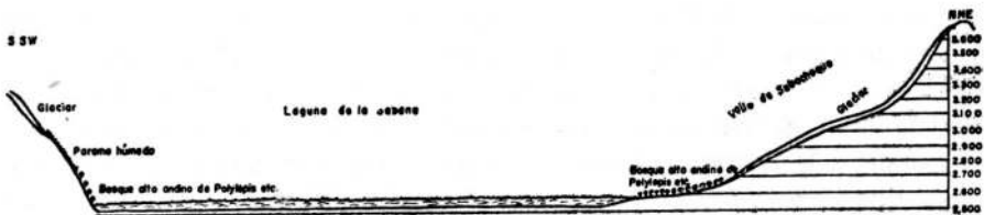
FIGURA 1. Corte esquemático Norte-Sur en la Sabana de Bogotá en el Pleniglacial medio.

Aunque el Pleniglacial Medio y la fase inicial del Pleniglacial tardío presentaron ciertas fluctuaciones climáticas y de vegetación, hay una serie de características relativamente constantes o al menos dominantes en tiempo, que nos dan una imagen muy peculiar y diferente de la situación actual. En la Sabana de Bogotá y otros altiplanos de la Cordillera Oriental a alturas de aproximadamente 2.600-2.800 m se presentaron al mismo tiempo las características siguientes: altos niveles en las lagunas, clima moderadamente frío, vegetación de bosque alto andino con abundante Polylepis (entre 2.600 y 2.900 m), sedimentos fluvio-glaciales hasta el nivel de la Sabana y morrenas glaciares hasta niveles de 2.700 y 3.000 m. Estos hechos llevan a la conclusión que las lagunas glaciares y bosques alto-andinos deben haber estado en contacto al menos localmente, especialmente en los valles que bajan del páramo a la propia Sabana de Bogotá. La presencia de troncos y trozos de madera en los sedimentos fluvio-glaciales, parecen confirmar esta apreciación.