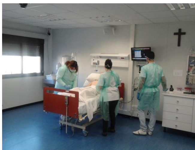
Foto 1. Alumnos de 3º de enfermería trabajando en un escenario de simulación.

Algunos autores han argumentado que la formación por competencias es fundamental en la enseñanza enfermera pero no es menos importante ofrecer las herramientas necesarias para la adquisición de las mismas (14) y eso es lo que pretendemos con la inclusión de la simulación. Creemos que el máximo nivel competencial puede asegurarse gracias al uso de simuladores, en particular los de última generación. La simulación permite que los alumnos se familiaricen con situaciones extraídas fielmente de la realidad asistencial y que se escenifican en una sala en la que ellos interactúan y donde se supone que adquieren conocimientos, habilidades y conductas. Sin embargo, está aceptado por los expertos en simulación que la adquisición de competencias individuales en habilidades clínicas no es suficiente; la coordinación del equipo, la comunicación y la cooperación son esenciales para una práctica asistencial eficaz y segura (15) . En la evaluación de los alumnos de enfermería que planteamos hemos incluido ítems que evalúan el trabajo en equipo y las habilidades de comunicación entre los propios profesionales y entre profesionales y pacientes.