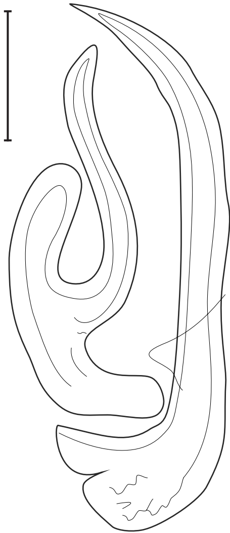
Fig. 3. – Lamellodiscus sanfilippoii n. sp. Morphologie des pièces sclérifiées de l'appareil copulateur mâle. Échelle : 10 µm.

barres latérales dorsales dans le sous-groupe “ergensi” tel que défini par Amine et Euzet (2005). Ce sous-groupe comprend : Lamellodiscus ergensi Euzet et Oliver, 1966, L. kechemirae Amine et Euzet, 2005 et L. tomentosus Amine et Euzet, 2005, tous parasites de Diplodus sargus , et L. baeri Oliver, 1974 parasite de Pagrus pagrus (Linnaeus). Le parasite décrit se distingue de toutes ces espèces par la morphologie des barres dorsales plus larges et nettement plus tourmentées ainsi que par la structure de l'appareil copulateur. Il se rapproche de L. furcillatus Kritsky, Jiménez-Ruiz et Sey, 2000, parasite trouvé chez Diplodus noct (Valenciennes) dans le Golfe Persique, par la morphologie des pièces sclérifiées du haptère.