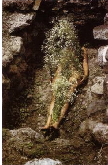
Figura 1. Ana Mendieta. Imagen de Yagul (Image from Yagul) , 1973. Lifetime color photograph. Original documentation: 35 mm color slide. © The Estate of Ana Mendieta Collection, LLC. Courtesy Galerie Lelong & Co.

A principios de junio de 1973 Ana Mendieta viajó a Oaxaca dentro de un programa universitario 7 . Se unió como coordinadora del University of Iowa Summer School Multimedia Program . Durante su estancia visitaron lugares arqueológicos como Monte Albán, Mitla, Yagul, Dainzú (Herzberg, 2004, p.159). En el trayecto hacia las ruinas de Yagul la artista le comentó a sus acompañantes algunos aspectos para colaborar en la ejecución de su obra. Compraron flores con las que cubrió su cuerpo mientras permanecía en posición decúbito supino, con los brazos a los costados en el interior de una tumba. La escena se fotografió desde diferentes ángulos 8 . Cuando volvieron a Iowa se organizó una exposición con los trabajos realizados, donde Ana Mendieta expuso Imagen de Yagul (Fig. 1). A partir de entonces aparecieron numerosas interpretaciones con distintas aproximaciones y valoraciones. Resumimos cronológicamente las más relevantes para nuestro estudio.