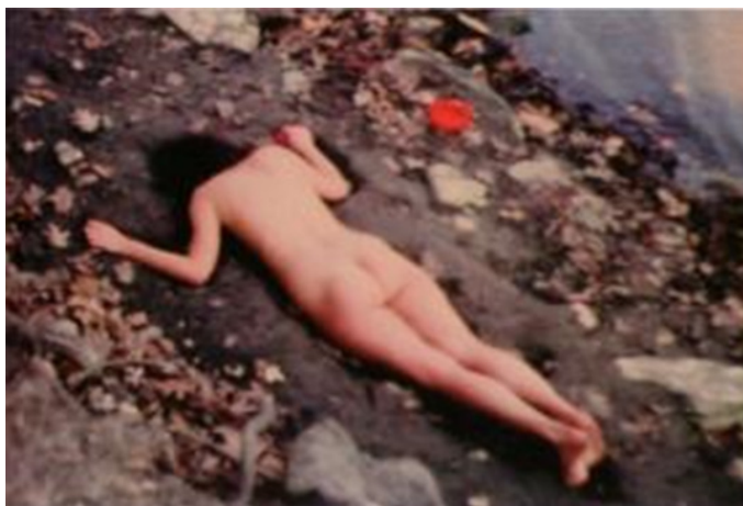
Figura 5. Ana Mendieta. Corazón de Roca con Sangre , 1975. Still from super-8mm film transferred to high-definition digital media, color, silent. Running time: 3:14 minutes.