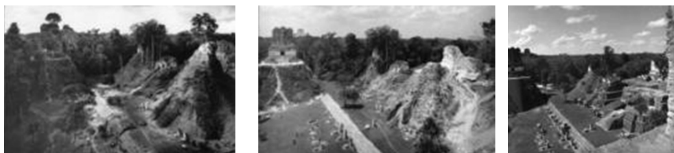
Figura 3. Tres fotografías de Tikal. Norman Carver. (Carver, 1986, pp. 82-83).

El trabajo fotográfico se describe como un punto de vista principalmente visual, evocando la arquitectura en su estado original sin ignorar sus aspectos pintorescos, añadiendo que muchas de estas ciudades estaban ocultas por la jungla cuando llegaron los conquistadores. Las fotografías buscan significativamente el impacto visual y artístico, más que documental, componiendo en blanco y negro unas representaciones donde determinados elementos arquitectónicos son los configuradores de la imagen. Las asombrosas cualidades arquitectónicas aparecen sumamente valoradas, ofreciendo al espectador un impactante encuentro con el mundo precolombino. Las evocaciones paisajísticas junto con el realzado valor estético de la piedra hacen que la temática adquiera una atractiva marca del legado arquitectónico, mostrando un punto de vista del documento con sentido poético del cual procedería el título de la publicación.