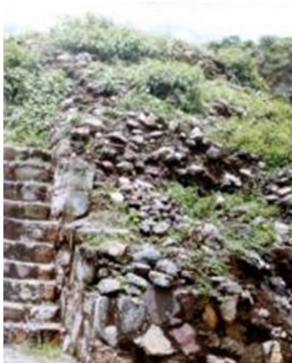
Figura 2. Ana Mendieta. Burial Pyramid , 1974. Still from Super-8 mm film transferred to high-definition digital media, color, silent. Running time: 3:17 minutes.

Al conocer cuáles podrían ser las intenciones del movimiento artístico feminista (rescatar la memoria de una historia olvidada, fragmentada o borrada), definir a la cultura precolombina como el símbolo de los símbolos perdidos , y al tener en cuenta la línea crítica de Herzberg, podemos plantear de nuevo que si Imagen de Yagul (Fig. 1) representa una historia olvidada del mundo precolombino debemos preguntarnos de qué historia se trata. Para responder a ello nos situaremos en la línea teórica de Julia Herzberg y nos centraremos en su frase del año 2003, cuando dijo que: “El cuerpo de Mendieta simbolizaba los restos físicos y culturales que marcaban el paisaje de Oaxaca.” Esto nos introduce en la corriente estética del paisaje. Ahora bien, respecto a otra de sus obras de un año después, Burial Pyramid (1974) (Fig. 2), de nuevo la autora (2004, p.166) observaría lo siguiente: (...) “ella es como un artefacto auto excavado encontrado en una ruina arqueológica.” En esta pieza la artista está enterrada entre piedras de las que emerge lentamente. Y aquí es donde encontramos el origen de la historia fragmentada de Imagen de Yagul (Fig. 1).