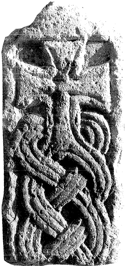
Fig. 2. Fragment de pilastre

intérêt; et nous avons donc décidé, dans le cadre des accords de coopération archéologique franco-croate, d'engager là un important programme de recherche. Lors d'une visite sur place en octobre 1994., l'ouverture de la première campagne a été fixée pour le début de l'été suivant.