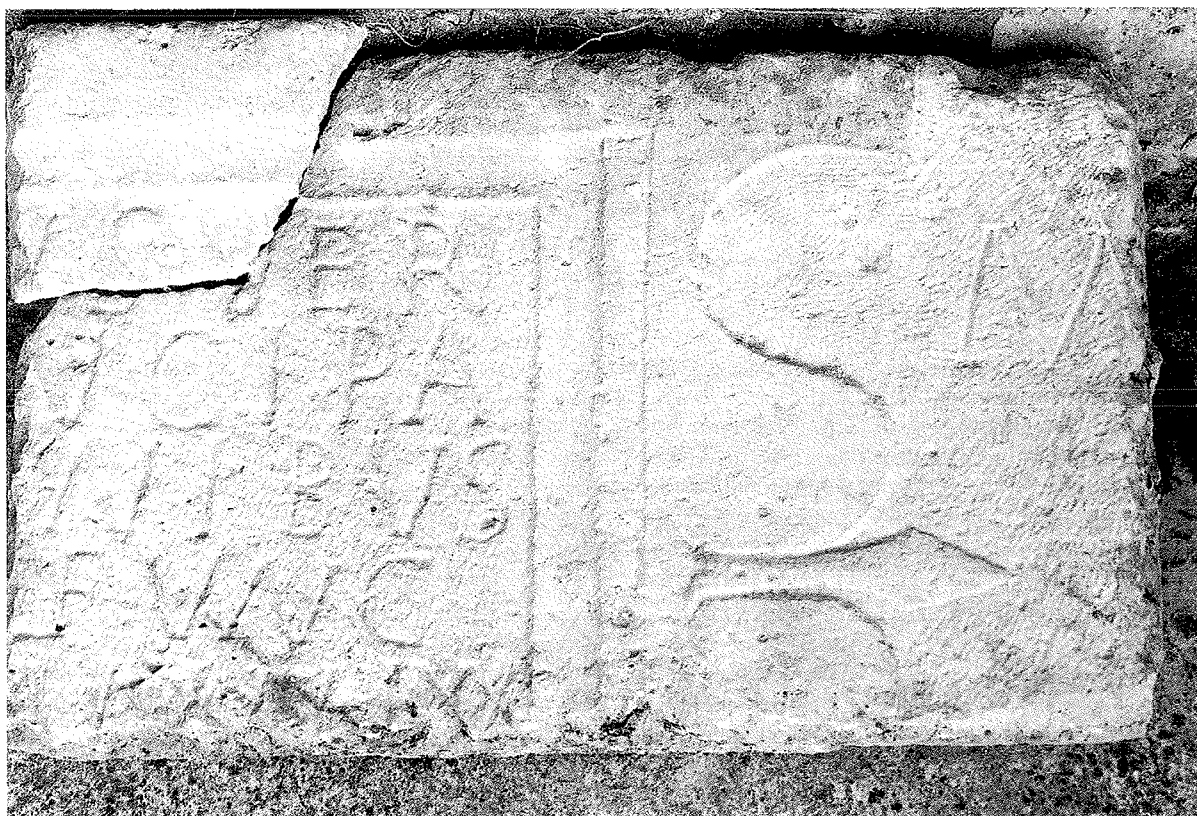
Fig. 5. Fragment de sarcophage païen

Istraživanjem u 1995. godini definirali smo tlocrt ranokršćanske crkve, otkrivši zapadnu fasadu te dvije baze stupova sjeverne kolonade in situ , čime su sve nepoznanice tlocrtne dispozicije prvotne građevine otklonjene. Sondom u svetištu crkve otkriveni su temeljni zidovi za postavu liturgijskih instalacija unutar kojih se može raspoznati nekoliko faza od ranog kršćanstva do u zreli srednji vijek, no uvijek na gotovo istoj niveleti prvotnog temeljenja. U tim iskopima, kao i čišćenjem sjevernog broda do izvornog poda pronađeno je pedesetak fragmenata arhitektonske plastike i liturgijskog namještaja crkve, od ranokršćanskog sloja, preko nekoliko predromaničkih faza do zrelo srednjovjekovnih fragmenata. Čišćenjem pak terena zapadno i južno od crkve, uočili smo početke zidova koji govore da je crkva Vele Gospe dio većeg kompleksa, a dvadesetak metara južno od crkve pronašli smo, dosad neubiciranu, malu pravokutnu građevinu, sačuvanu u elevaciji, koju prema prvom čitanju valja datirati u rani srednji vijek (trompe u apsidalnom dijelu).