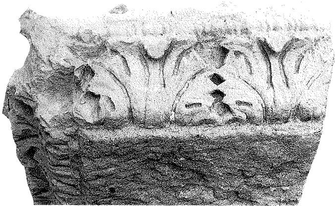
Fig. 6. Imposte de pilastre d'angle

On a pu descendre, là aussi, au niveau d'utilisation d'origine à l'entrée du chœur: une fondation de chancel apparue dans la partie nord du sondage, et le dégagement devra en être poursuivi; mais il est d'ores et déjà acquis que ce chancel correspond à un remaniement, puisqu'un fragment d'architrave haut-médiéval orné d'arcades et de motifs floraux y avait été incorporé. L'un des autres acquis importants de cette première intervention a été en effet la trouvaille d'une dizaine d'éléments sculptés des installations liturgiques (cf. quelques exemplaires fig. 2-4): il s'ajoutent ainsi à ceux qui avaient été recueillis voici une quinzaine d'années; ces éléments, relevant manifestement de plusieurs phases pré-romanes et romanes