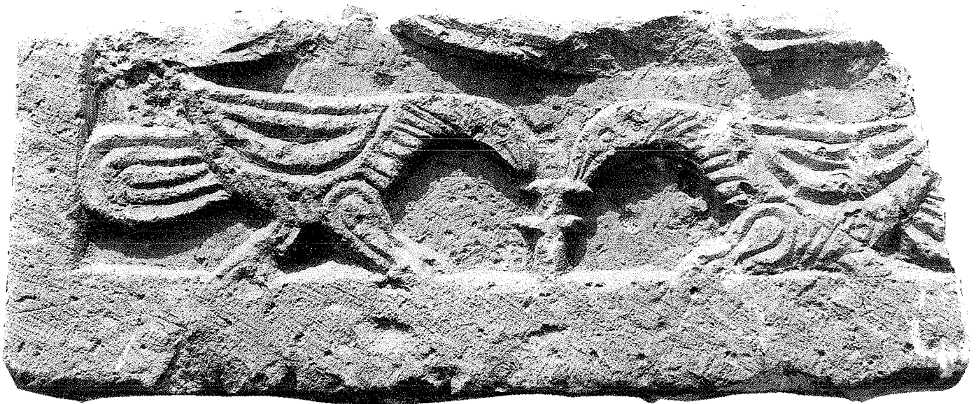
Fig. 3. Fragment de dalle de chancel, avec oiseaux affrontés

Dans la nef centrale, on a, après photographies et relevés graphiques, déposé le dallage de l'église moderne (ce dallage sera naturellement remis en place après la fin de la fouille).