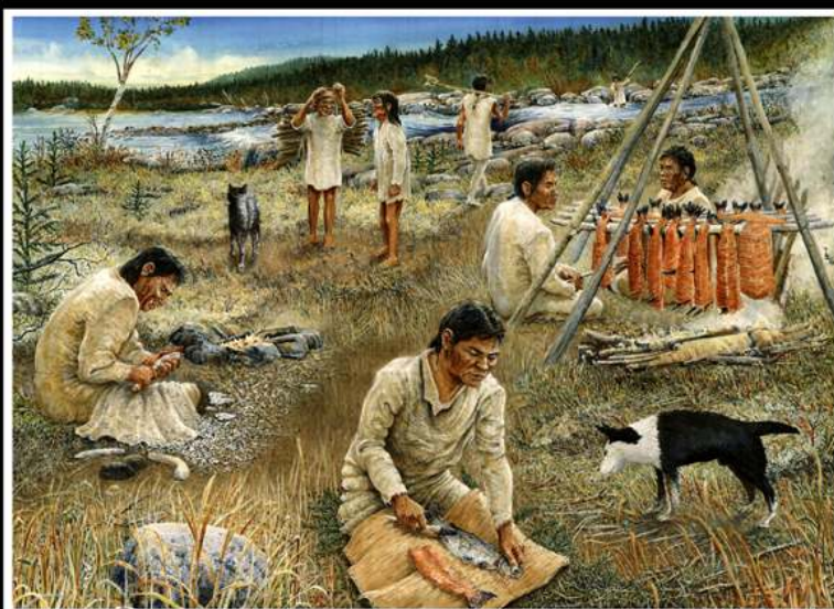
Le site archéologique EbCx-069: un campement de pêche aux abords de la rivière Mingan près de 2 000 ans avant aujourd'hui

À court et moyen termes, le PRAE est appelé à se poursuivre dans sa forme actuelle, et plusieurs thématiques de recherches sont toujours au programme. Cependant, en lien avec cette capacité d'intervention et de gestion accrue, les Innus d'Ekuanitshit aimeraient bien voir leurs équipes archéologiques obtenir des mandats de la part de partenaires externes (agences gouvernementales, ministères, etc.). Ces mandats ne viseraient pas à remplacer le travail des firmes de recherche en archéologie, mais plutôt à réaliser un