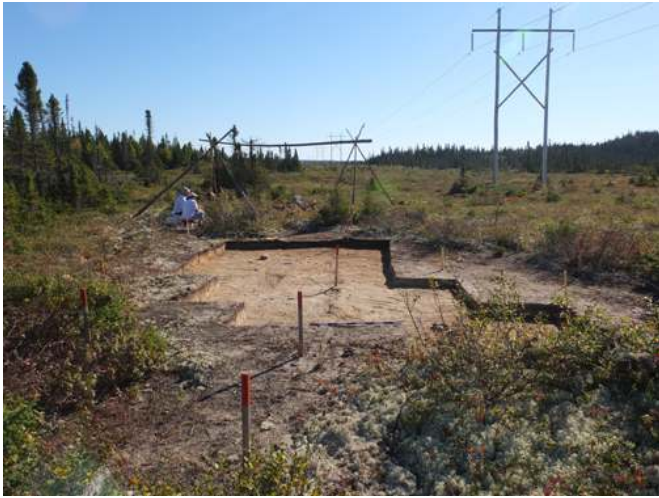
Figure 10 Aperçu général du site archéologique EbCx-65, station 10

plus profond dans le bois pour s'abriter des vents et du froid quand il restait au bord de la mer à l'automne ou l'hiver [...], mais ici c'est exposé de tous les côtés, il n'y a pas de zone abritée. En plus, il n'y a pas de lac pour prendre de l'eau ou du poisson. (Patrick Michel, comm. pers., été 2015)