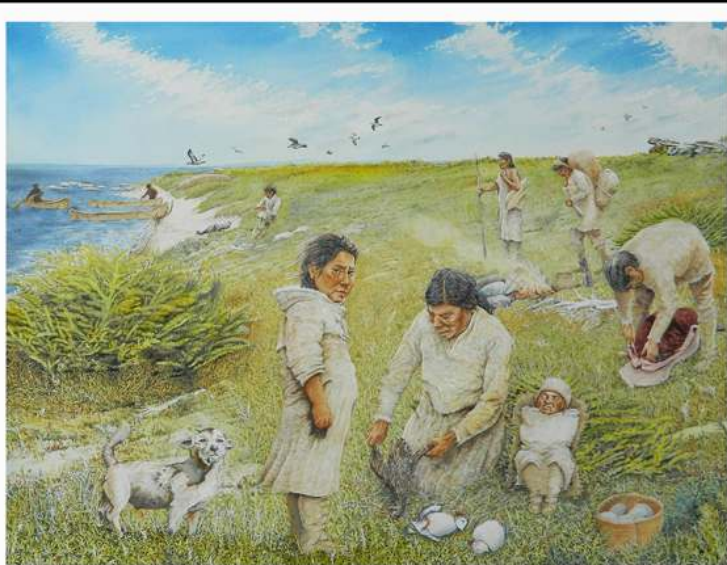
Ekuanitshiu ministukua... un campement amérindien