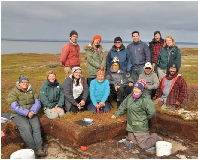
Figure 11 Visite au site 62G de l'île Nue par les représentants de la communauté innue d'Ekuanitshit et de l'Unité de gestion de Mingan (Parcs Canada)

susceptible de favoriser des rapprochements avec son partenaire Parcs Canada (fig. 11).