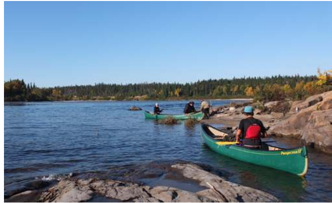
Figure 8 Déplacements en canot sur la rivière Mingan

La présence abondante de charbon de bois associé à ces structures sur EbCx-69 tend à indiquer une utilisation prolongée ou soutenue alors que l'absence de sols rubéfiés sous les pierres indique que le dégagement de chaleur produit n'était pas particulièrement intense (Ouellet 2015 : 52). Ces indices indirects s'ajoutent aux observations de M. Michel et tendent aussi à renforcer l'interprétation de la structure comme un fumoir. Pour lui, l'absence d'os de saumon parmi l'assemblage archéologique n'est pas problématique en soi. D'une part, il soutient n'avoir jamais trouvé ou observé de vertèbre de poisson sur les divers sites où il a travaillé, bien