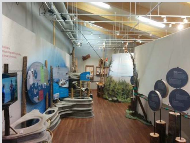
Figure 2 Fragment de l'exposition permanente à la MCI d'Ekuanitshit