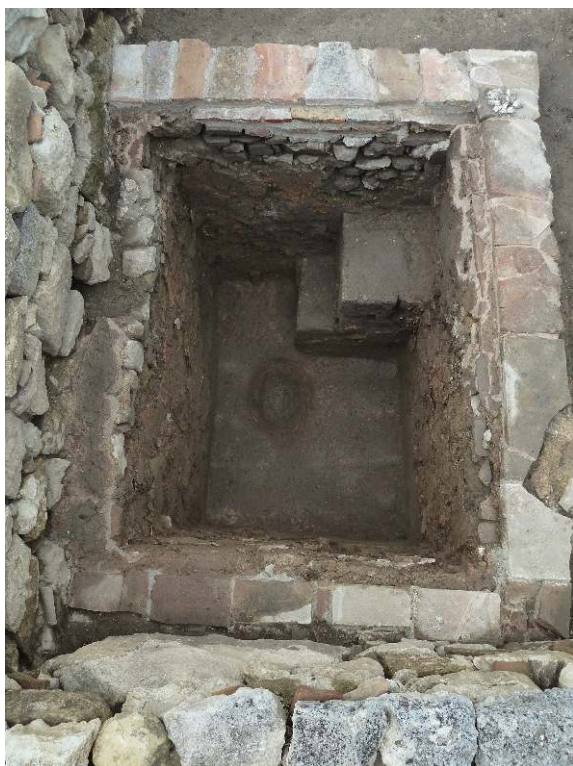
Fig. 2 – Vue zénithale de la cuve de vinification du chai épiscopal (seconde moitié du VI e siècle), cl. N. Beaudry.