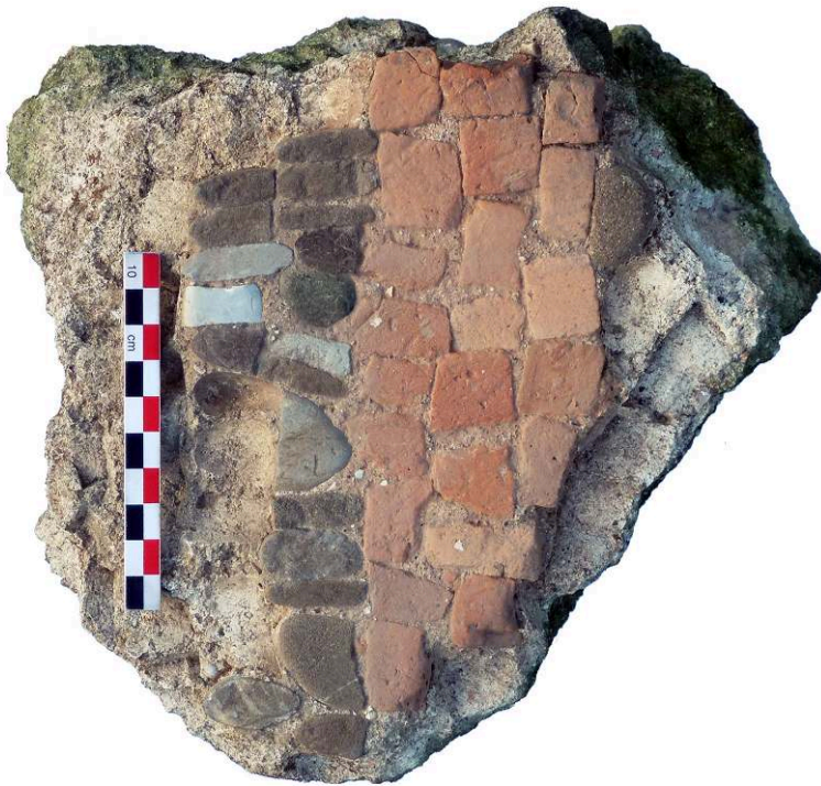
Fig. 5 – Fragment de pavement de mosaïque de l'étage du bâtiment D (cl. N. Beaudry).