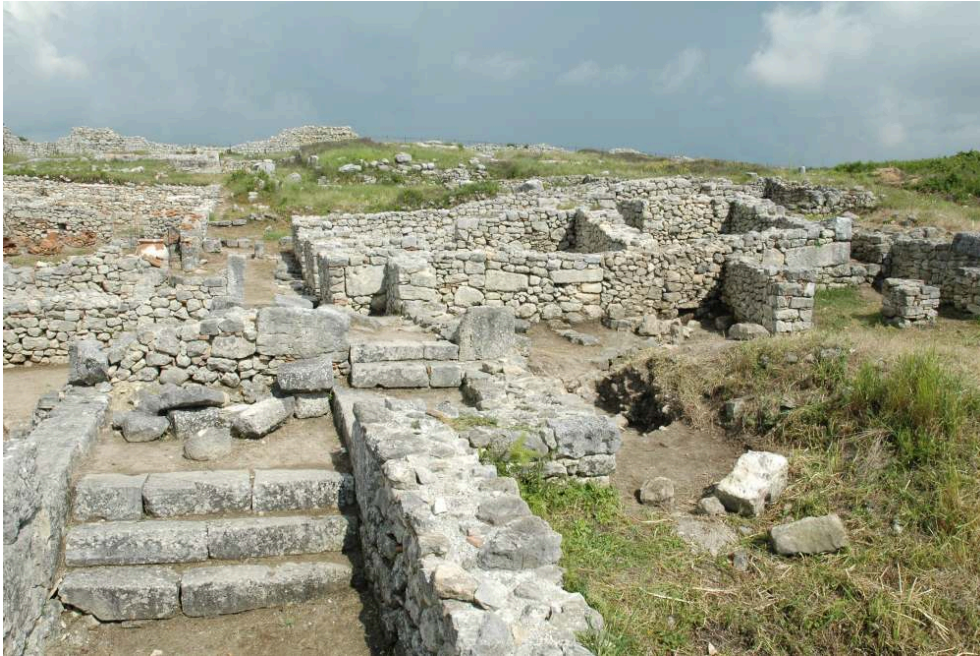
Fig. 4 – Le bâtiment tardif D vu depuis l'ouest.